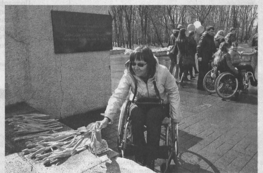
В парке им. В. Волошиной прошла акция «Цветы добра».