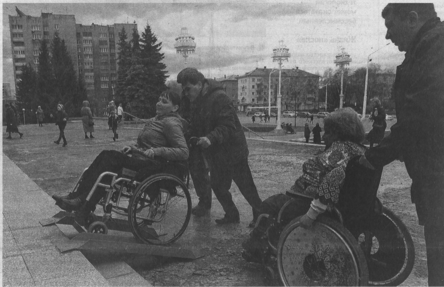
В этом году филармонию планируют оборудовать новым специализированным пандусом.

В Кузбассе создается служба сопровождения инвалидов. Уже с начала мая в Кемерове и Белове откроются диспетчерские пункты, куда сможет обратиться за помощью и советом любой человек с ограниченными возможностями