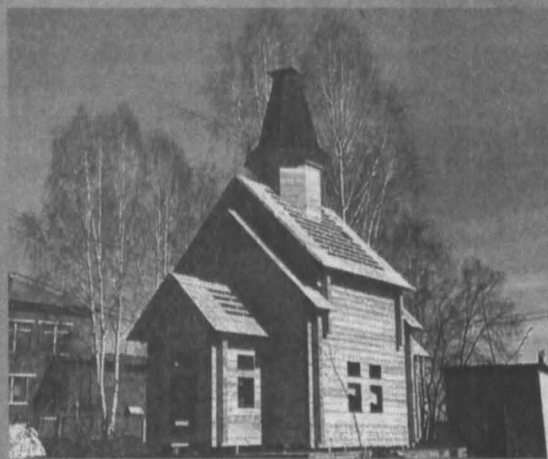
Если удастся собрать необходимую сумму, часовню в память о погибших горняках достроят к середине лета.

В прошлом году в рамках акции «Весенняя неделя добра» силами неравнодушных горожан было собрано более 650 тысяч рублей.