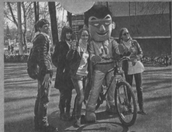
Проходить маршрут волонтерам помогал нукольный герой «Помогай-мен».