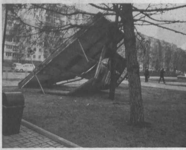
В Кемерове ветер повалил рекламный щит.