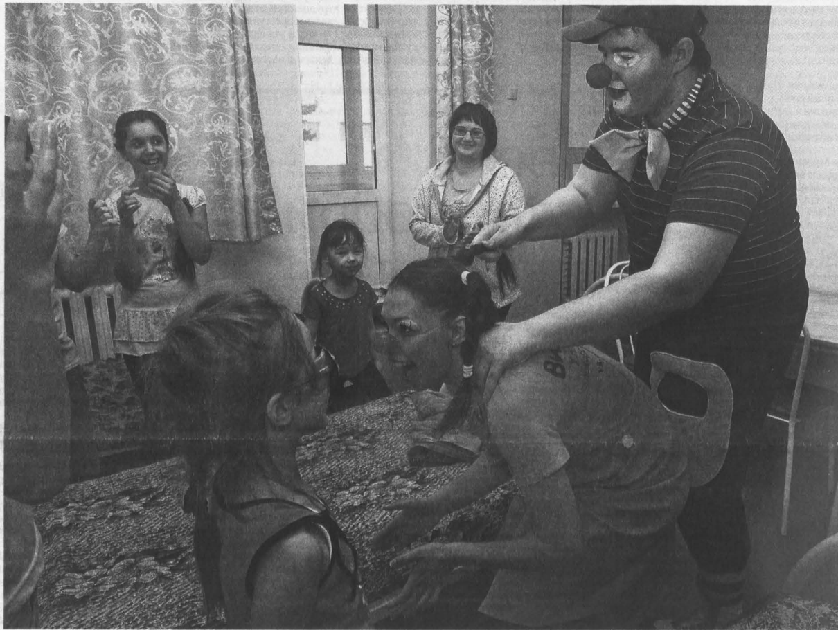
Отвлечь ребенка от болезни – главная задача больничных клоунов.

Что движет молодыми людьми, которые готовы все свое свободное время посвящать бескорыстной помощи другим, выяснял корреспондент «Кузбасса»