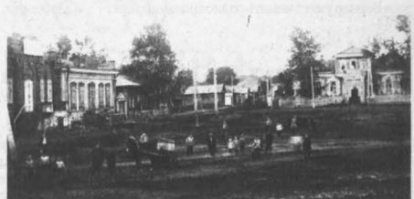
Сейчас Советская площадь в Новокузнецке располагается на месте бывших Соборной и Базарной площадей.

Поначалу просьбу скорректировать план главное управление Западной Сибири отклонило. Тогда 12 июля 1840 года кузнецкое общество от имени городского судьи Рудакова вновь обратилось с прошением, но уже в Министерстве внутренних дел, к его управляющему графу А.А. Строганову. Тот отправил