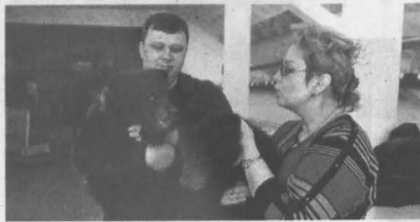
Косолопам братьям придется расстаться.