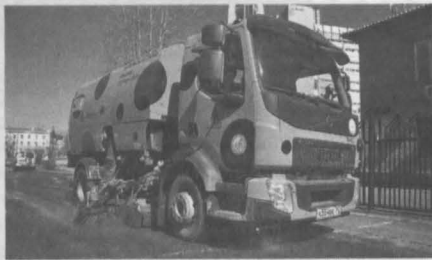
Вот так выглядит городской «дворник» нового поколения.