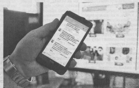
Самое важное правило для предотвращения ненужных рекламных рассылок – быть внимательным при заполнении анкет, скидочных и бонусных карт в магазинах.

Извещение о проведении повторных торгов по продаже арестованного имущества в форме аукциона, открытого по составу участников и по форме подачи предложений о цене имущества. Организатор торгов: Общество с ограниченной ответственностью «Лотос», ОГРН 1124205010720, ИНН 4205245930, г. Кемерово, ул. Пчелобазы, д. 20, оф. 1, тел.: 44-12-93, 8-913-334-10-20.