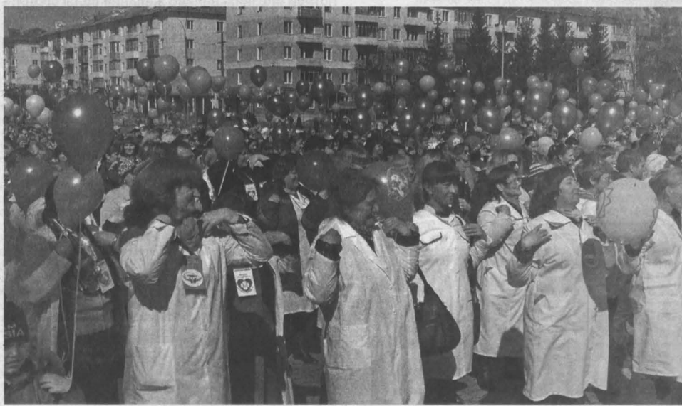
■ МИРОВОЕ ЗДОРОВЬЕ. Маршем и массовой зарядкой отметили вчера в Междуреченске Всемирный день здоровья. Так шахтерский город приобщился к масштабной акции «Время быть здоровым!» в рамках объявленного президентом РФ В.В. Путиным Года борьбы с сердечно-сосудистыми заболеваниями. Единую колонную медиков и горожане прошлись по центральной улице, спортсмены провели массовую зарядку и запустили в небо шары. Дети врачи раздали витаминные и гематоген, а в фойе ДК «Распадский» измерили горожанам артериальное давление, определили уровень сахара в крови.