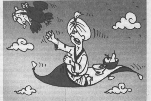
■ Рисунок Андрея Горшкова.

– У моего отца в молодости случай был. Просто выпивал с попутчиками, и через какое-то время они невинно предположили перекинуться в кармашки. Сначала на интерес, потом на символические ставки... В итоге отец проиграл все сбережения на отпуск, часы, портмоне и даже пиджак. А меня с братом он потом научил не только в карты не играть с попутчиками, но также ни-