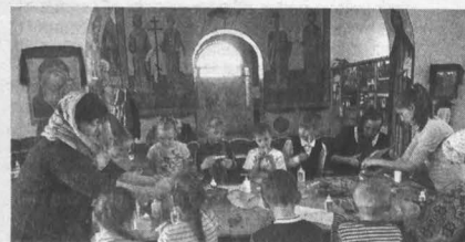
■ ПАСХА БЛИЗКО. В Никольской церкви пос. Кривинский прошёл мастер-класс по изготовлению пасхальных сувениров.