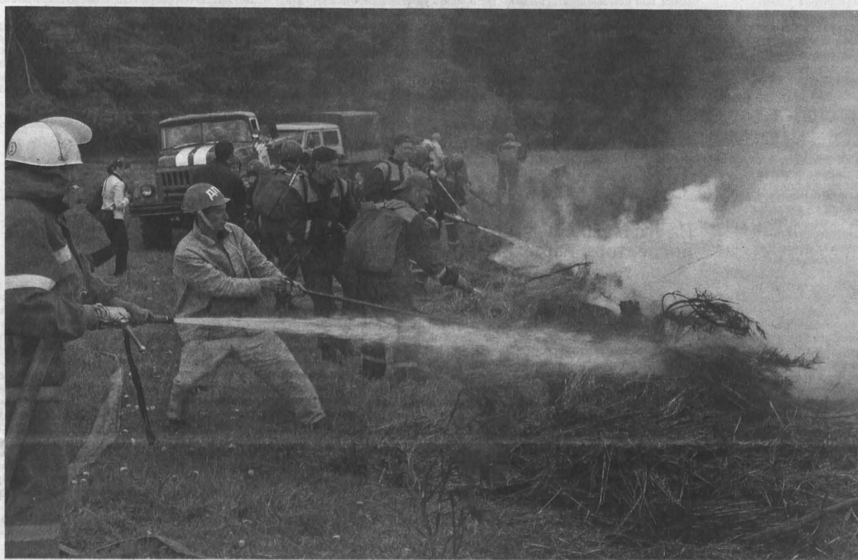
■ В Кузбассе стало традицией проводить профилактические учения в пожароопасных местах.

С начала апреля в Кузбассе открыт пожароопасный сезон. Традиционно он продлится до установления холодной погоды в наших широтах, то есть до октября