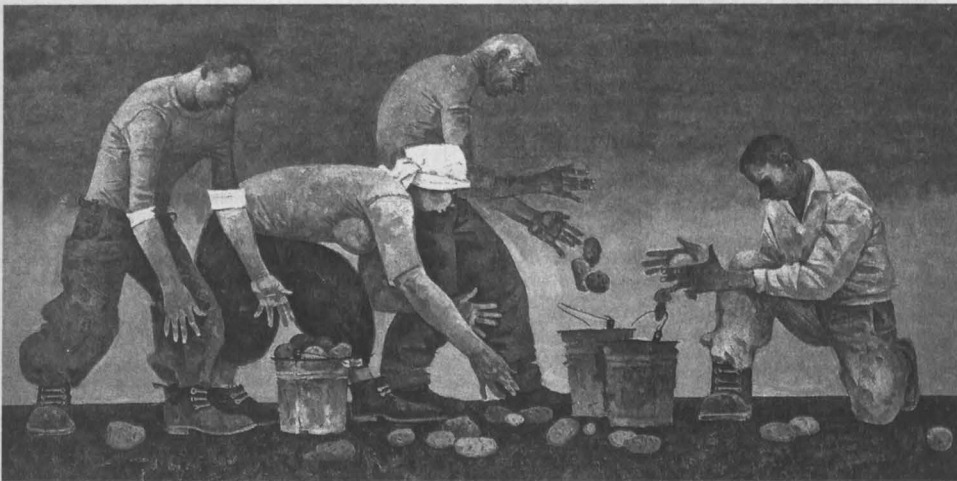
«Время убирать картошку».