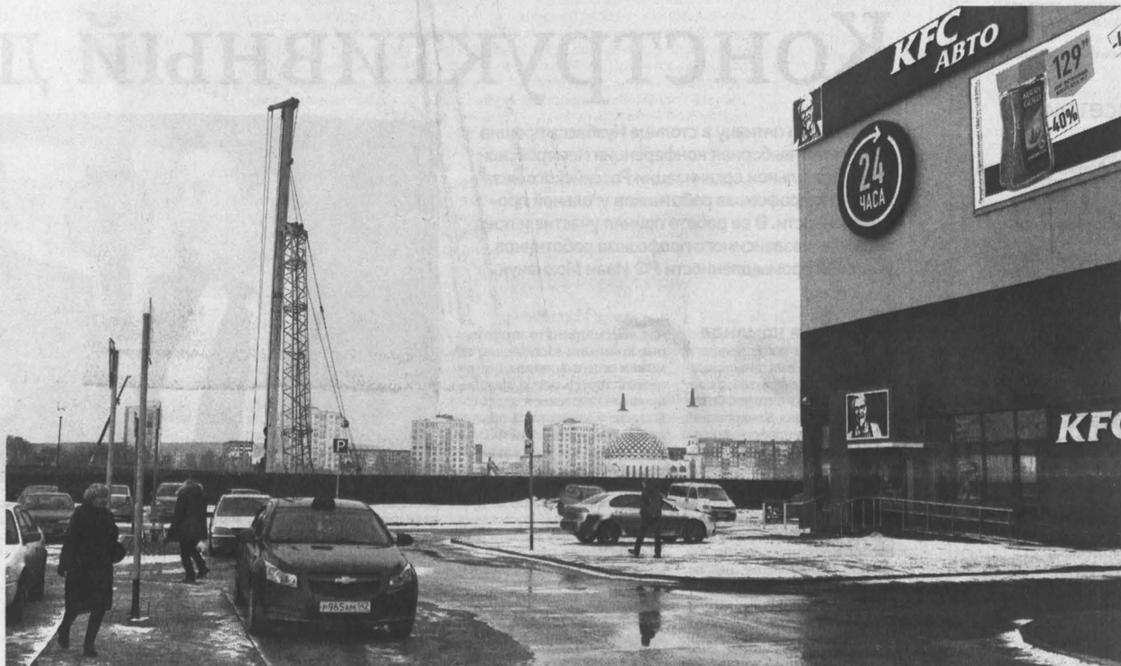
■ В Кемерове рядом с «Лентой» возводится гипермаркет строительных материалов «Леру Мерлен».

Пока огнеборцы по всей стране проверяют крупные торговые центры на предмет безопасности для граждан, в Кузбассе возводятся новые объекты крупных «сетевиков». Как все надеются — радующие сервисом, адекватными ценниками. И такие, где можно не опасаться за жизнь и здоровье