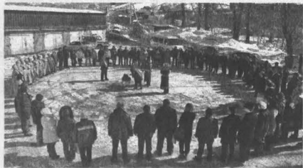
■ Делегаты съезда проводят обряд благопожелания.