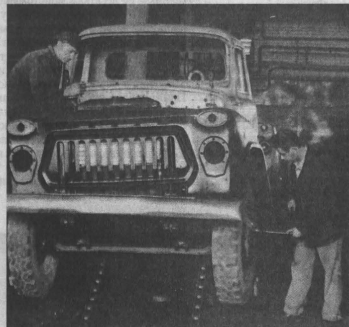
Ремонт автомобиля «ГАЗ-53».