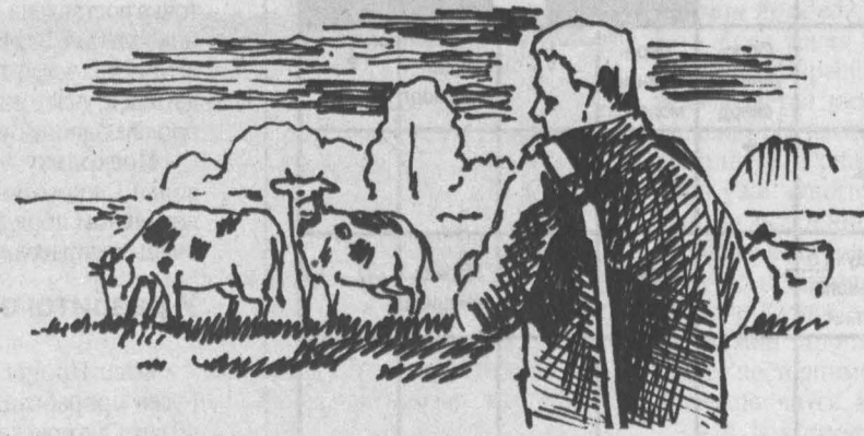
Рисунок Андрея Горшкова.