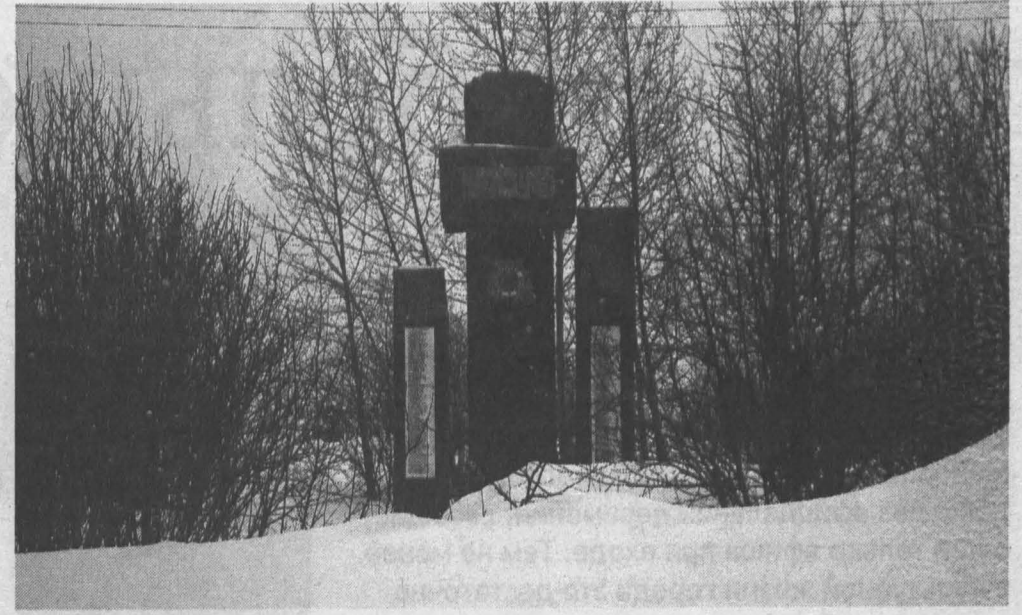
Памятник в селе Силино.