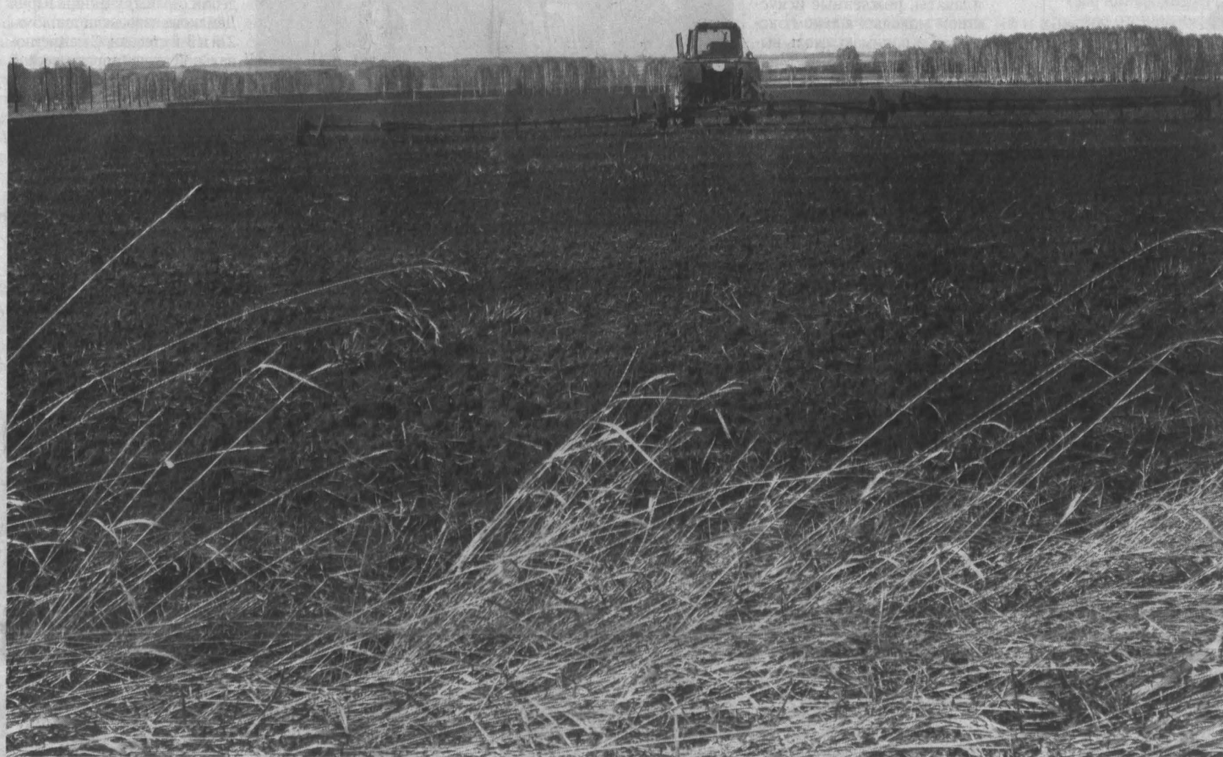
Таковыми наши поля станут всего через месяц.

Какие проблемы видны за полтора месяца до выхода в поле?