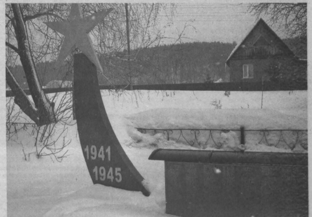
Памятник в селе Старочерво.