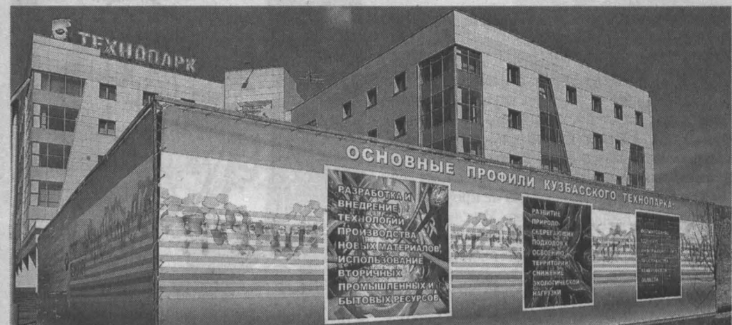
Кузбасский технопарк — главный инновационный центр Кемеровской области.