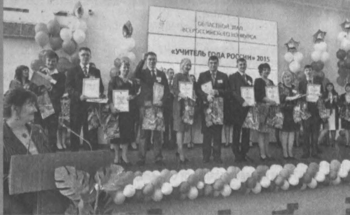
Финалисты конкурса.

В пятницу завершился областной этап всероссийского конкурса «Учитель года России»-2015.