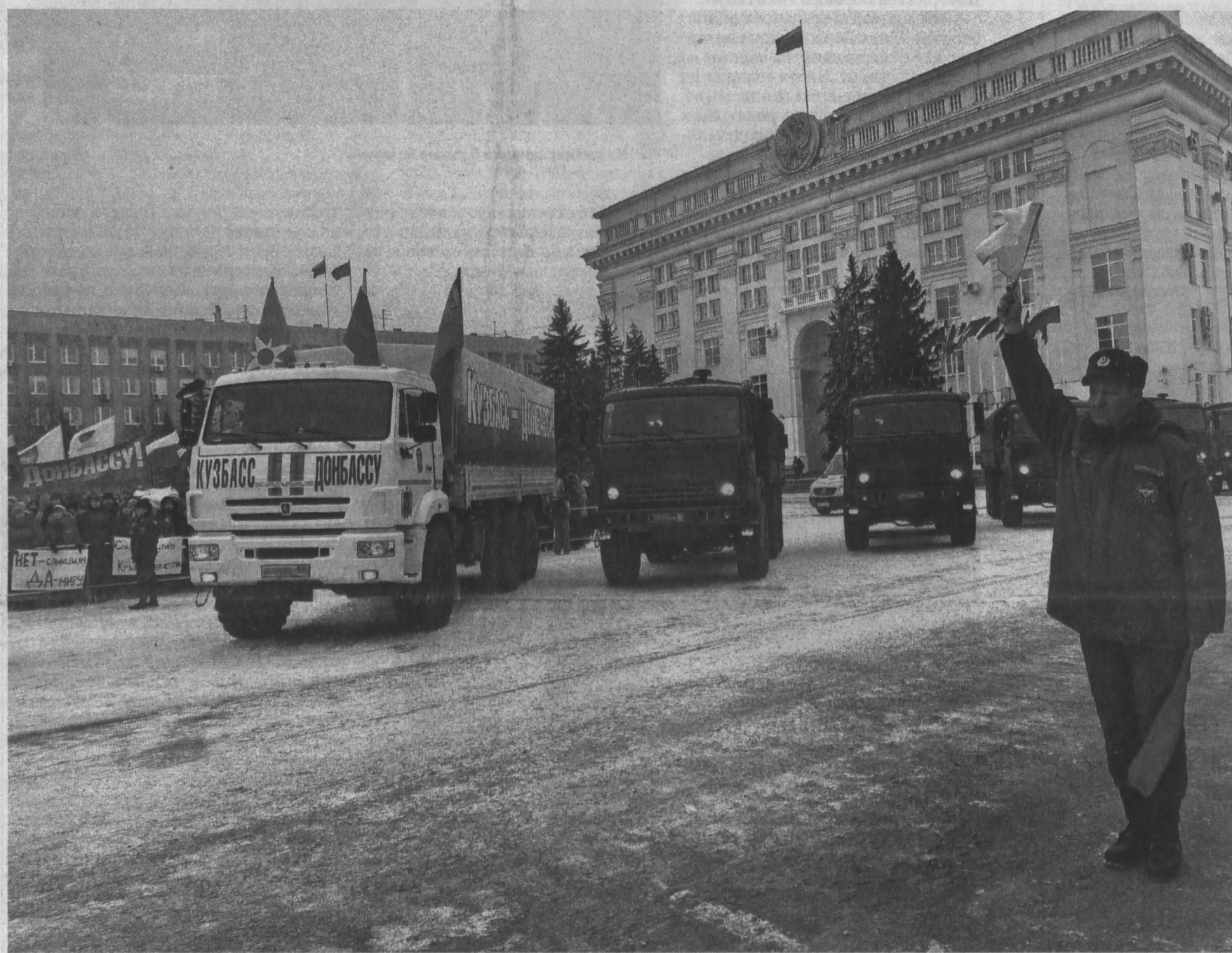
Команда «По машинам!», и колонна тронулась в путь.

Вчера из Кузбасса в разрушенный Донбасс ушла колонна грузовиков со стройматериалами, лекарствами, продуктами и вещами