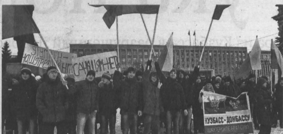
На митинг пришло 5 тысяч человек.

Донецка в ответ на мою записку (что Кузбасс отправляет «гуманитарный» груз к вам, в Донбасс): «Спасибо за то,