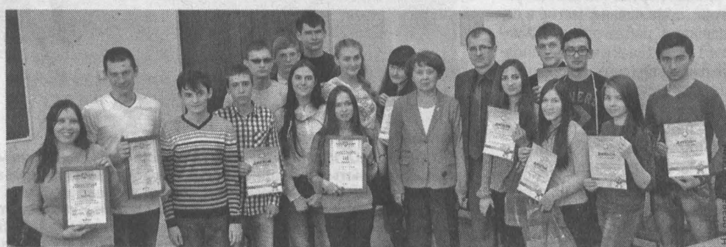
«Награды – сильнейшим»: победители и призеры олимпиады.

Для кого-то из этих старшеклассников первое знакомство с лекционной аудиторией КузГТУ может оказаться знакомством с вузом, в котором им предстоит учиться. 13 марта в Кузбасском государственном техническом университете по инициативе КОАО «Азот» (предприятие входит в структуру ОАО «СДС Азот») состоялась олимпиада по химии среди школьников десятых-одиннадцатых классов города Кемерово. Задачи для олимпиады, оптимально приближенные к уровню школьной программы, подготовил институт химических и нефтегазовых технологий КузГТУ. Участие в олимпиаде, организованной предприятием и вузом, – возможность для учеников получить дополнительные баллы, которые будут учитываться при поступлении в КузГТУ.