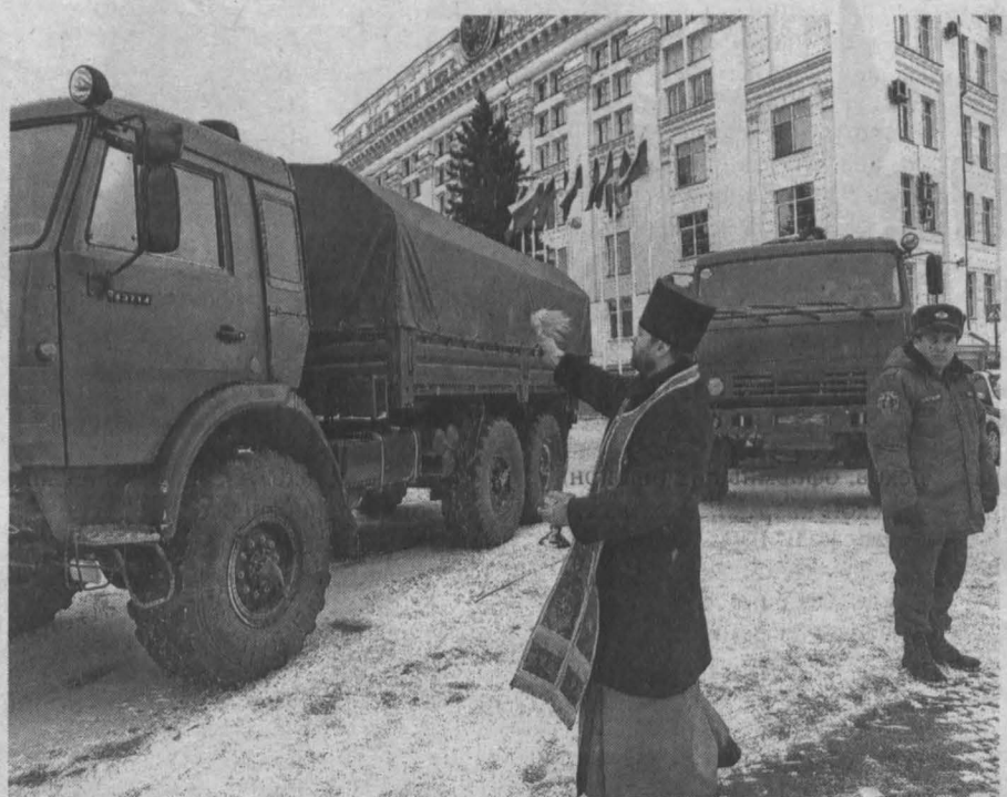
Благословение перед дальней дорогой.