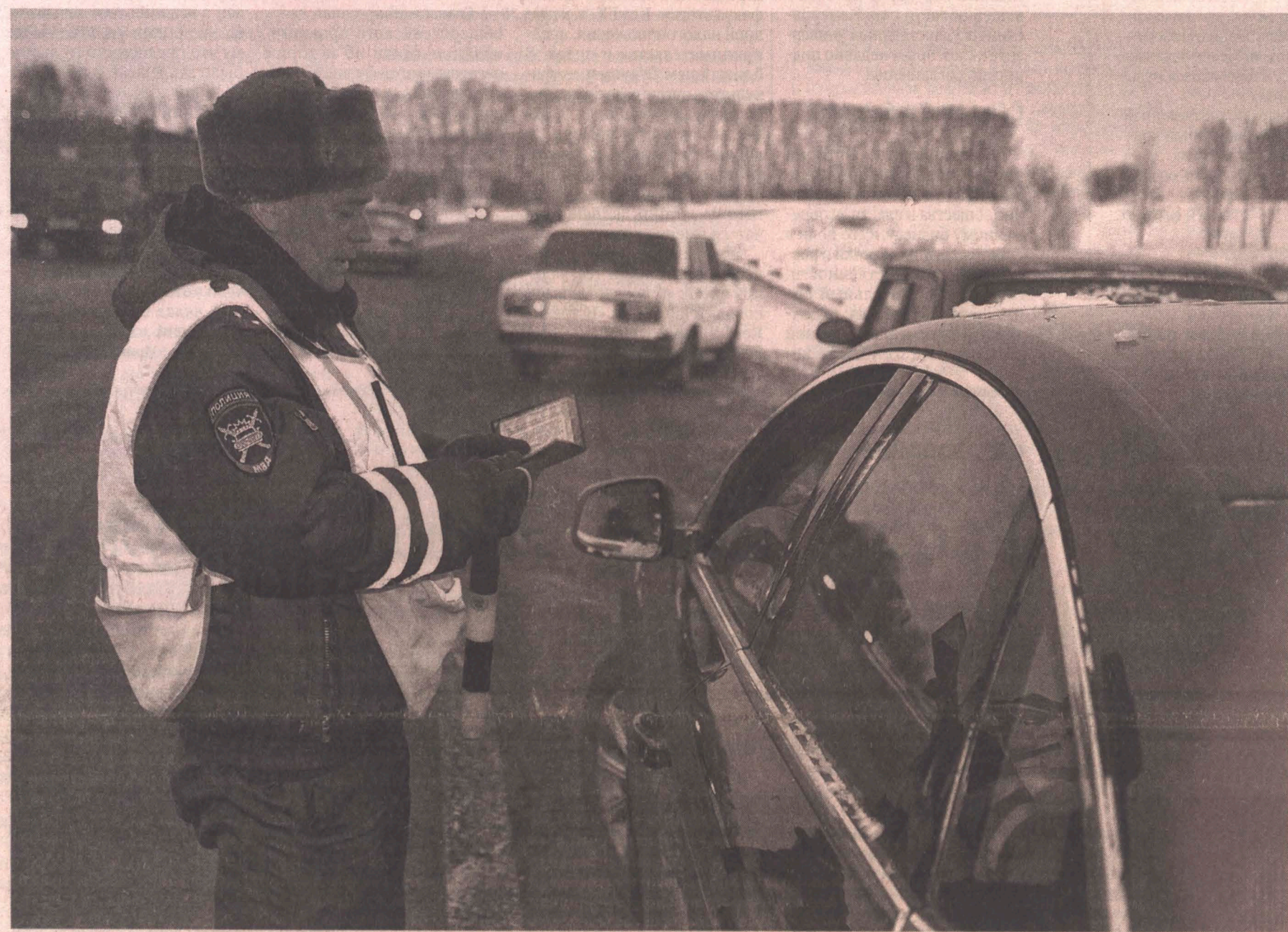
В числе первых на сигналы об угонах автотранспорта реагируют инспекторы ГИБДД.

Из Уголовного кодекса России предлагается исключить понятие «угон» и наказывать за него, как за кражу