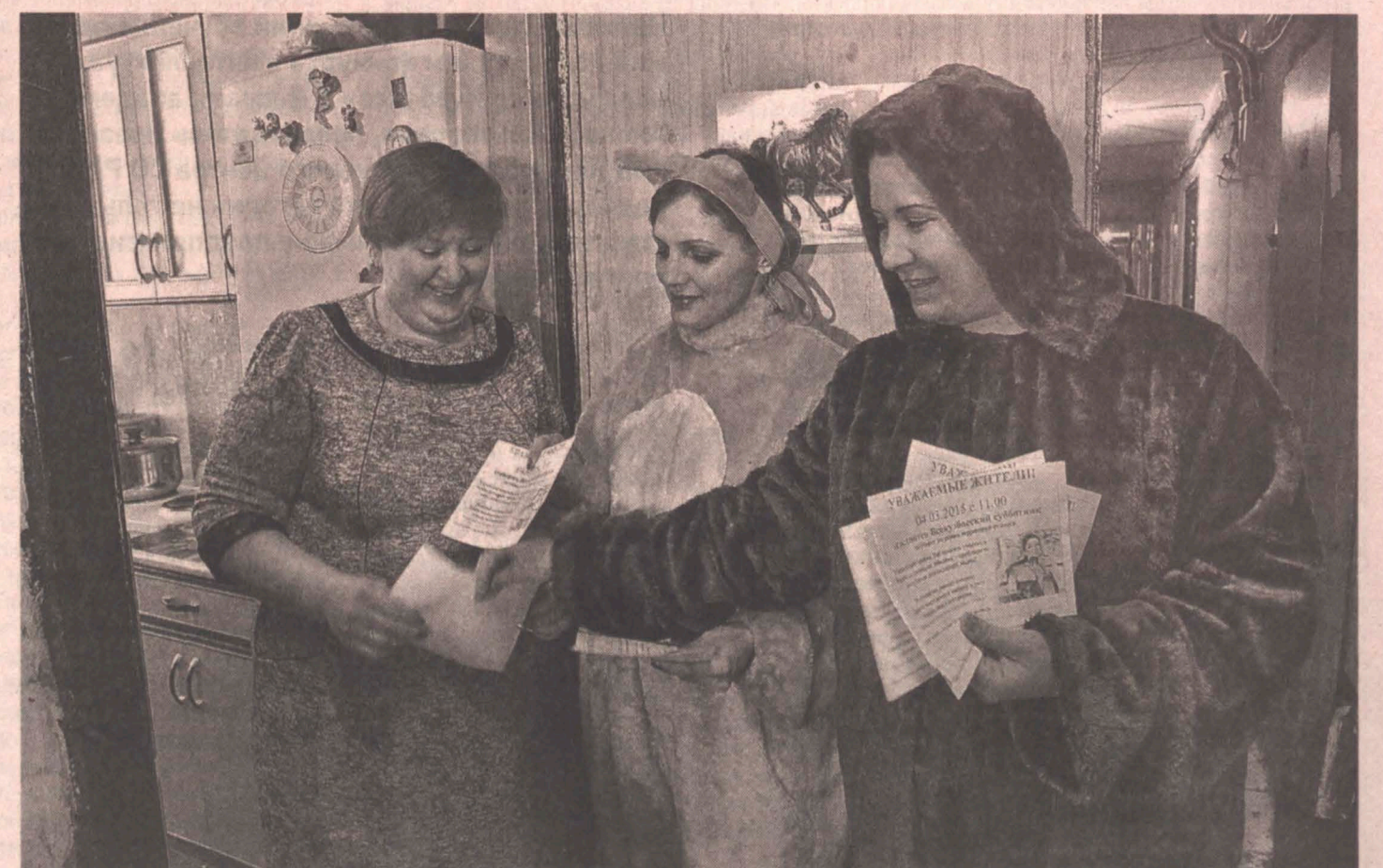
Медведь и лиса приглашают... кемеровчан на всенкузбасский субботник. Напомним, вчера газета писала об инициативе губернатора перенести традиционную «тулеевскую» пятницу, которая приходится на предпраздничный день, на сегодня. Аман Тулеев обратился к сотрудникам предприятий, бюджетных и коммерческих организаций, а также к бойцам студотрядов с просьбой помочь коммунальщикам в уборке снега. Вчера ростовые куклы раздавали горожанам приглашения на субботник.