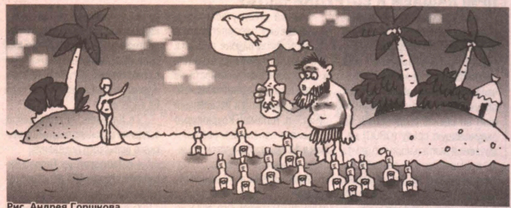
Рис. Андрея Горшкова.