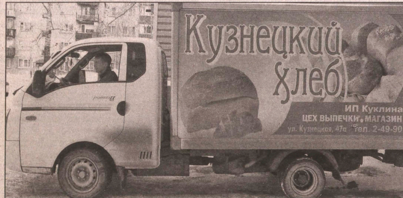
Кузнецкий хлеб поехал к посредникам.