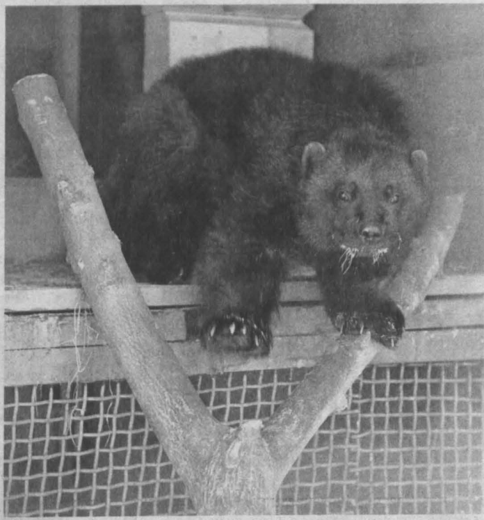
В Новокузнецком мини-зоопарке одна из главных изюминок – редкий зверь россомаха.

Зиму наши обитатели пережили хорошо, но еще будет непростой для них переход к весне. Копытные готовятся и начинают сбрасывать рога. Первым их сбросил лось Лесик: сначала