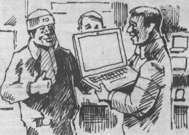
Рисунок Андрея Горшнова.

Искренне радовался житель Промышленновского района за своего бывшего одноклассника, когда тот купил себе автомобиль. Парень не знал, что расплачивается приятель деньгами, снятыми с его счета.