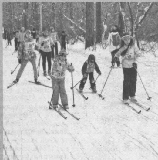
На центральный старт «Лыжня России-2015» в Кемерове, на базе СДЮСШОР №3, вышли 2150 человек.

В Маринском прошел промежуточный этап районного чемпионата по мини-футболу на снегу среди мужских и юношеских команд.