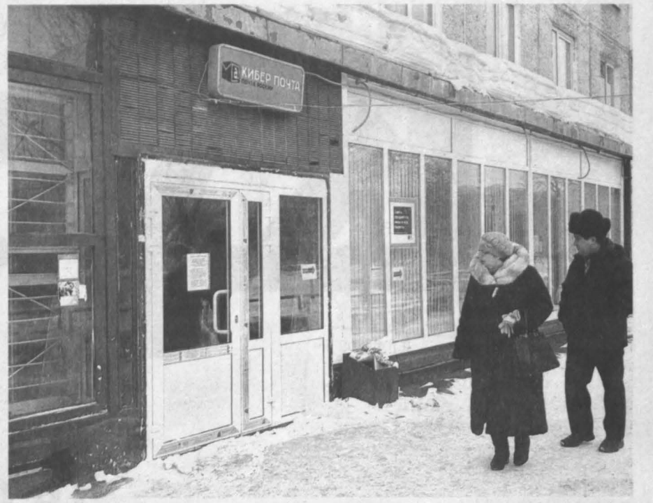
Почта есть, а входа нет.