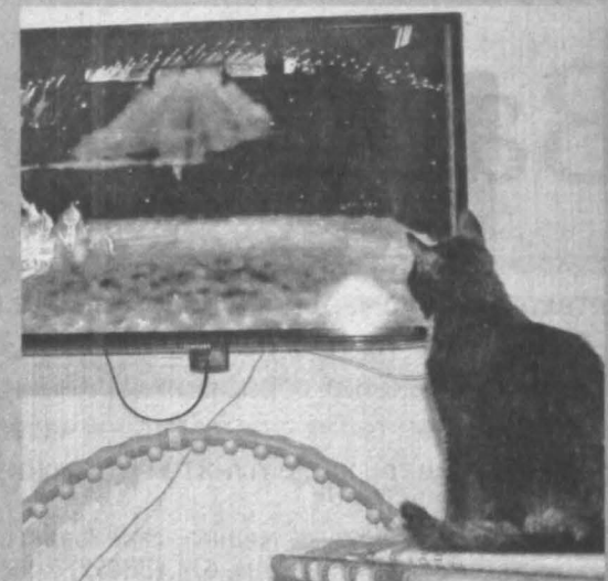
Вспомнить о том, как проходила Олимпиада, мог любой желающий, посмотрев трансляции центральных ТВ.

В соревнованиях приняли участие сотрудники предприятий города, молодежь и ветераны маринского футбола.