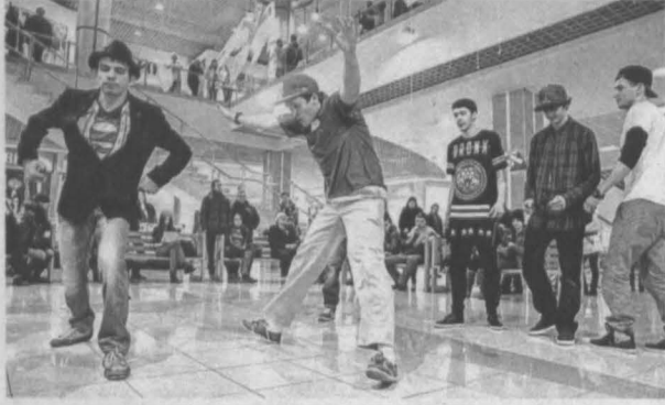
Танцевальный стиль «Робот» еще способен закипать