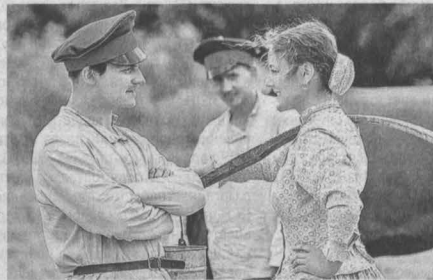
Новый Гришка Мелехов в сериале Тихий Дон (2015)