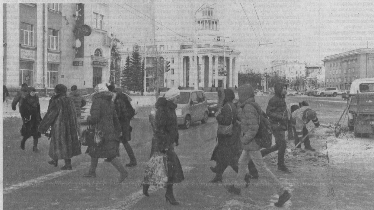
Прирост населения в Кемерово, учитывая его столичный статус в регионе, представляется вполне естественным.

Кемерово впервые стал самым большим по численности населения городом в Кузбассе. Такой своеобразный рекорд зафиксировали специалисты Кемеровостата