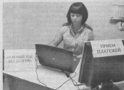
■ Участие граждан в акции исключительно добровольное, принудительно взыскивать долги во время нее судебные приставы не намерены.