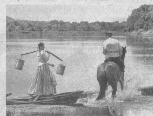
Волны после выхода «Тихого Дона» 4