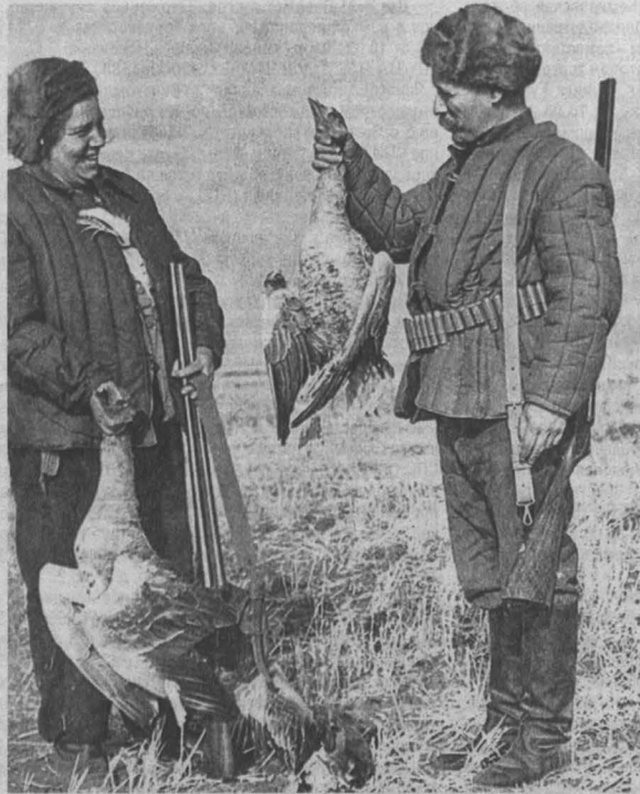
Шолохов с женой на охоте, 1948 год.

— И о сильных характерах! Вот почему я не смог принять новый фильм, — непримиримо выпрямляет спину