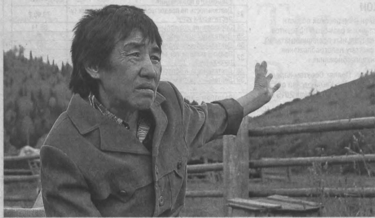
Один из очевидцев рассказал о зимней временной смерти необычных Тажных людей.