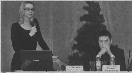
На круглом столе по федеральному закону №223 представители четырех электронных торговых площадок рассказали, как с ними работать.

Изменения в законодательстве о госзакупках, которые вступят в силу в 2016 году, должны облегчить малому и среднему бизнесу участие в электронных торгах. Между тем Единая информационная система госзакупок может не заработать с 1 января, как запланировано.