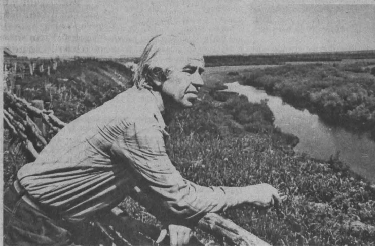
Поэт у озера Кайдор.

«Отрадно! Отрадно!» - сказал тогда Твардовский и помог Фёдорову перевестись на дневное отделение Московского литературного института. В те же годы лишь двое сту-