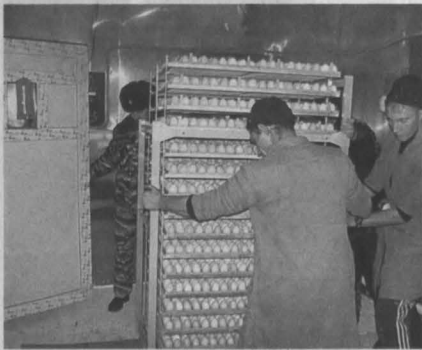
Закладка яиц в инкубатор.