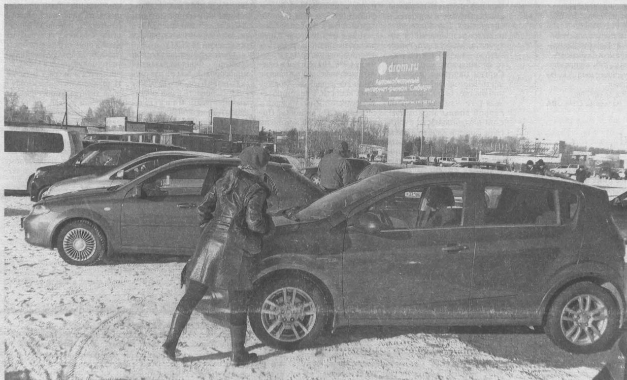
На авторинке в Кемерове.

Автомобильный рынок в Кузбассе, как и по всей стране, переживает нелегкие времена