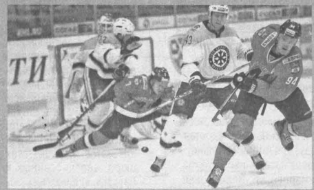
Момент победного поединка с «Сибирью».