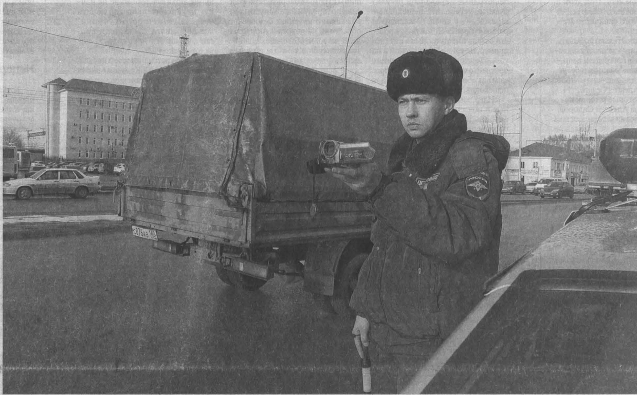
■ Оправдания нарушителей опровергнет запись видеокмеры.

Как себя вести пешеходам и водителям, чтобы их пути не пересекались трагически?