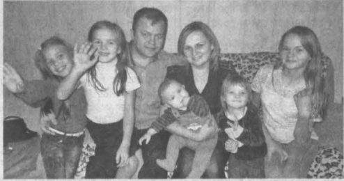
Семья Чудиных – уже с сыншмой – одна из самых многодетных среди кузбасских семей в погоне.