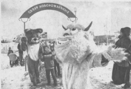
Новый городской скверик в честь новорожденных готов принимать гостей.