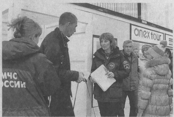
Туристы ждут багаж в аэропорту Кемерова.

Очередной рейс с кузбассовцами на борту из Египта прилетит в Кемерово 18 ноября.