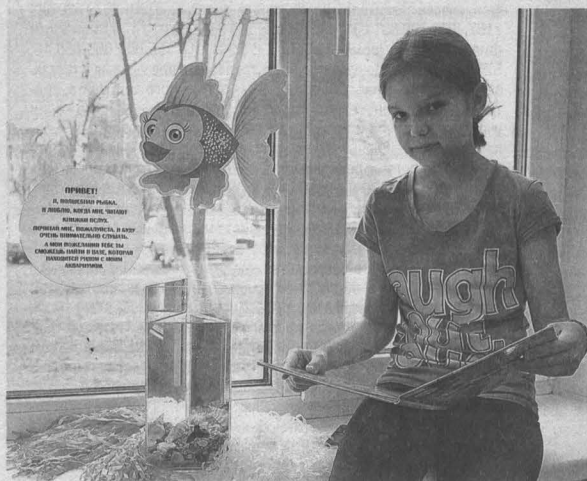
В Кемеровской областной библиотеке для детей и юношества юные читатели уже начали читать сказки живой золотой рыбки.

Парад спектаклей, перформансов и мастер-классов пройдет сегодня вечером на главных театральных и музейных площадках нашей области. Так Кузбасс отметит «Ночь искусств».