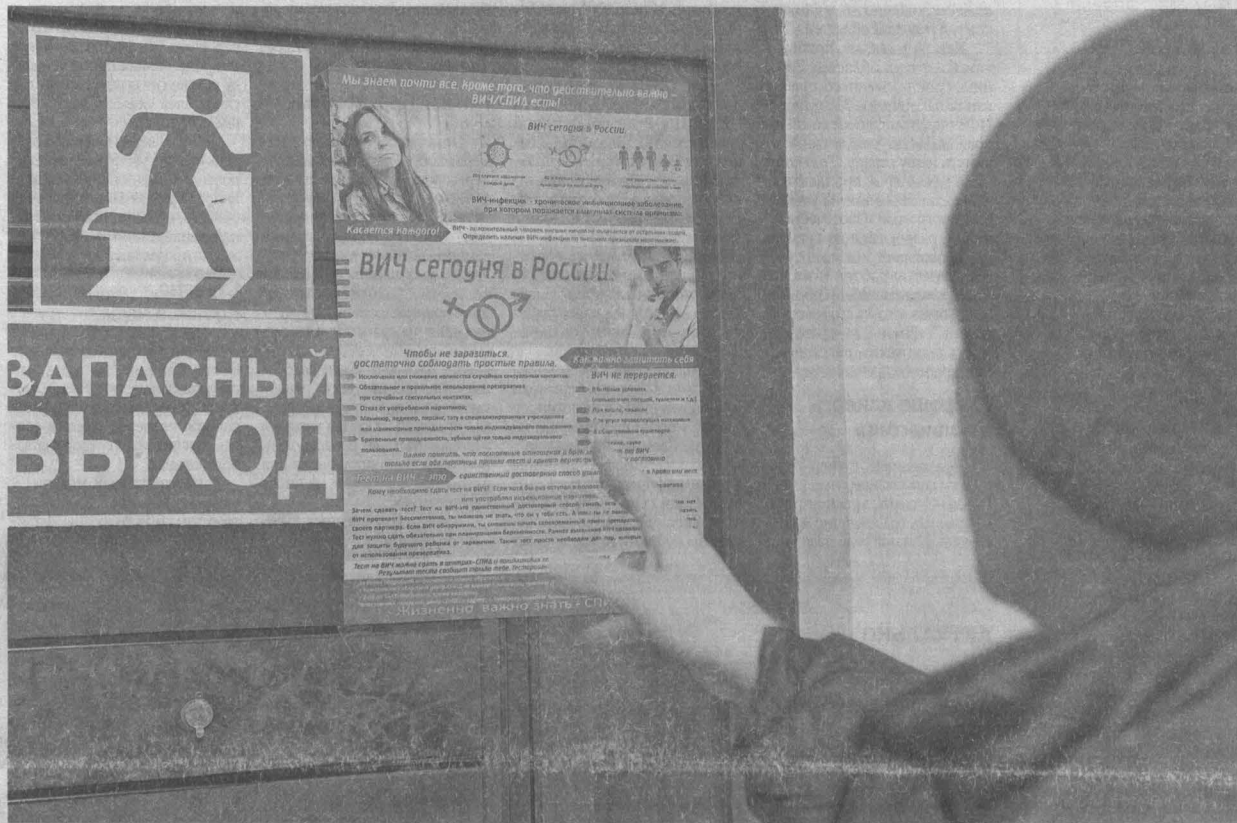
Акцент в деятельности службы анти-СПИД сделан сегодня на работающих гражданах.

Кузбасс вошел в число пяти территорий РФ, где по решению Минздрава начинается реализация пилотного проекта по широкомасштабной профилактике среди населения ВИЧ-инфекции и вирусных гепатитов В и С.