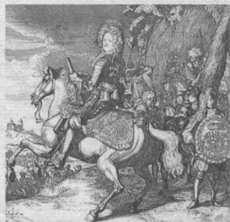
Александр Данилович Меншиков. Гравюра А.Ф. Зубова.

5 ноября 1714. Лондон. Первым русским членом иностранной академии наук стал «пленец гнезда Петрова» Александр Данилович Меншиков.