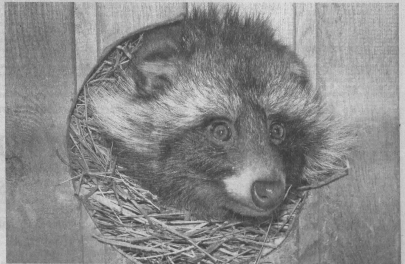
ВСЕ В ДОМИНАХ. Енотовидная собака по кличке Моська из музея-заповедника «Томская писаница» в трескучие морозы предпочитает не покидать свою «нору». И только когда сотрудники музея приносят еду, высовывает мордочку из гнезда. Как рассказали в «Томской писанице», из-за холодов все здешние животные — медведи, маралы, волки, рыси, олени и другие — переведены на усиленный режим питания. У каждого в вольере есть убежище, где они могут согреться и укрыться от ветра, поэтому звери благополучно переживают морозы.