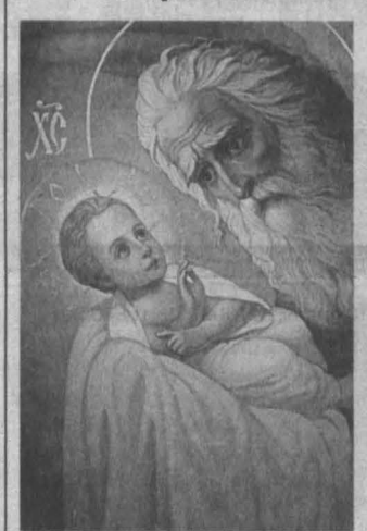
Сретение Господа нашего Иисуса Христа.