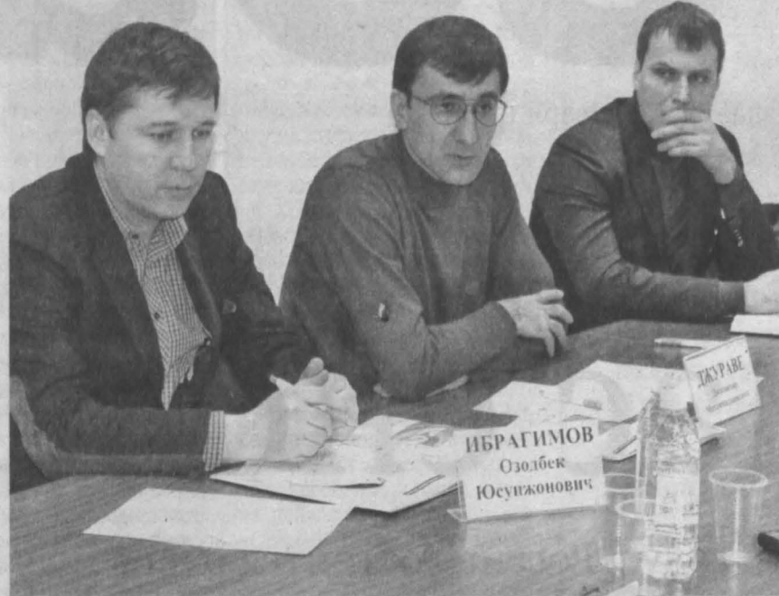
В течение пяти дней делегация из Узбекистана встречалась с бизнес-сообществом и представителями крупных оптовых компаний нашего региона.

же очень значим. «Узбекистан стремится выйти на широкий рынок, при этом формируется экономически обоснованное ценообразование, чтобы заинтересовать российских предприни-