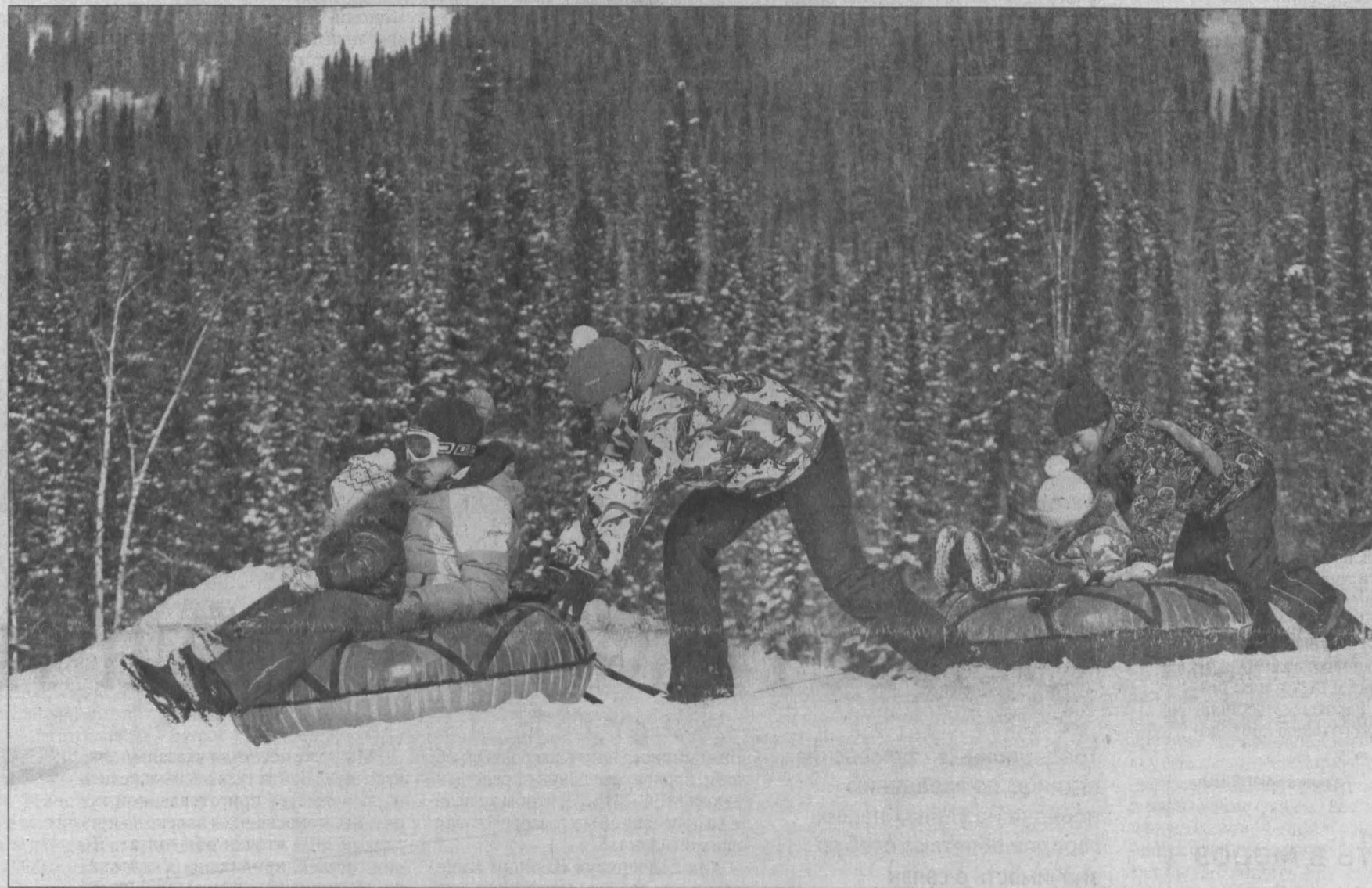
Подтолкнуть улучшение демографической ситуации в России можно разными инструментами. Микроперепись покажет, какие из них правильнее выбрать.

В 2015 году в России состоится очередная микроперепись населения. Это обследование будет заметно отличаться от аналогичных и содержанием вопросов, и инструментами, которые будут использовать переписчики.