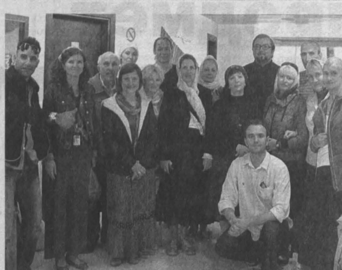
Замечателен не только тем, что построен на месте рождения Спасителя мира, но и древностью своих основных сооружений. Святая святых церкви Рождества — это маленькая пещера под алтарем, куда ведут

две лестницы, расположенные по правой и левой сторонам солей. По ним мы спускаемся вниз, в пещеру. Теплый ласковый свет от множества свечей и пятнадцать серебряных лампад окружают серебряную звезду. На ней надпись по латыни: Nic de Virgine Maria Iesus Christus natus est (Здесь от Девы Марии родился Христос). На противоположной стороне пещеры находится Алтарь Яслей, куда Богородица положила новорожденного Иисуса. Здесь не просто вспоминаешь библейскую историю, а проживаешь ее.