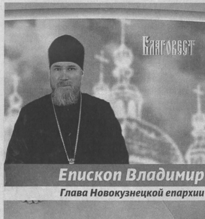
Епископ Владимир Глава Новокузнецкой епархии