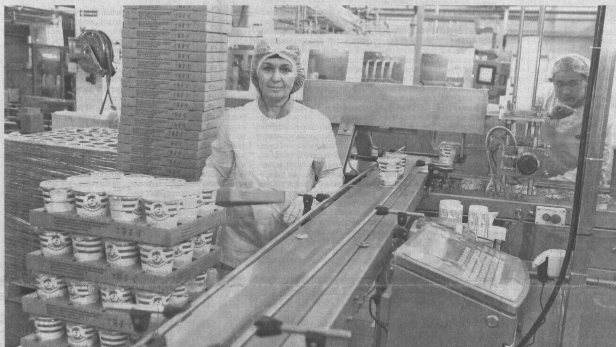
Хотя производство полностью автоматизировано, главное в работе — ответственность и компетенция каждого сотрудника.

Современный цех по производству детских молочных продуктов запустили вчера в Кемерове. В церемонии открытия приняли участие Аман Тулеев и генеральный директор группы компаний Danon в России Бернар Дюкро