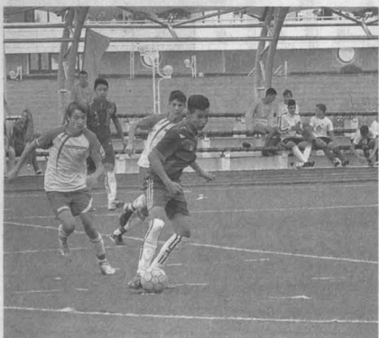
Кемеровская команда во время одной из игр во Владивостоке.