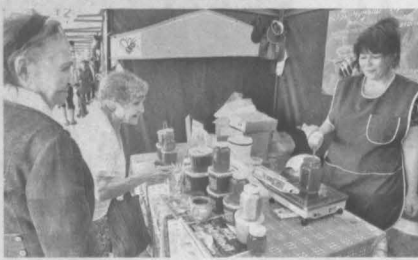
На ярмарке в Кемерове можно купить мед на любой вкус.