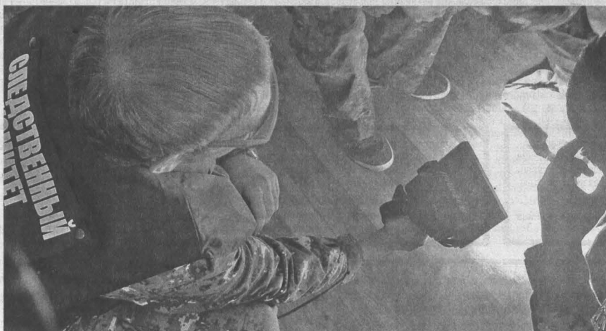
Источники криминалистического света показали, что на свежеструганных досках пола имеются замытые и внешне невидимые пятна крови.

P.S. Имена и фамилии потерпевшего и обвиняемого изменены.