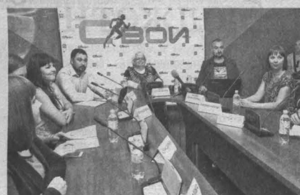
■ Презентация социальной сети «С-ВОИ». Фото Федора Баранова.