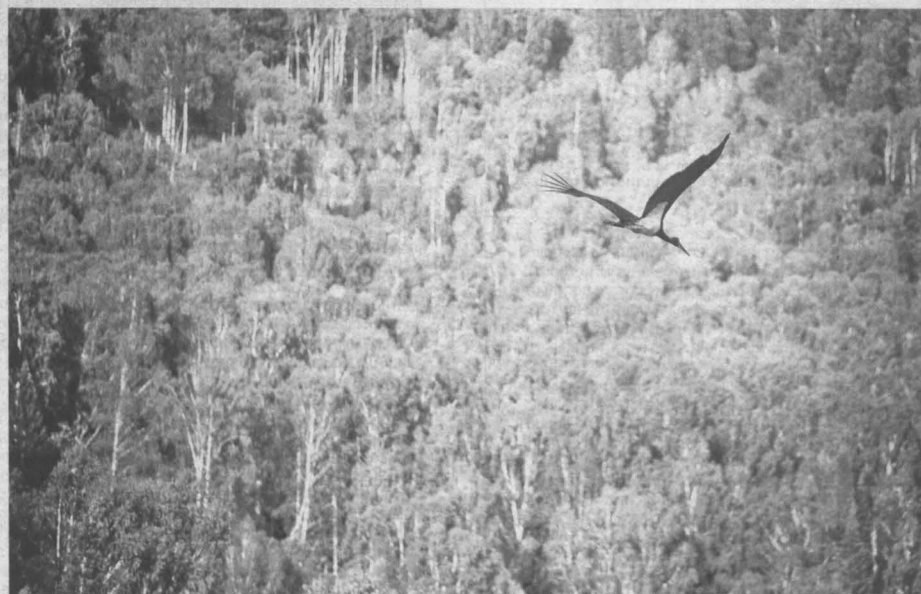
■ РЕДКАЯ УДАЧА. Фотокорреспонденту газеты «Кузбасс» удалось сделать редкие снимки – запечатлеть на территории Шорского национального парка «Краснокинский» черного аиста. По данным кузбасских орнитологов, на территории Кемеровской области ежегодно гнездится 12–15 пар черных аистов. Свои гнезда они обычно строят в горах Кузнецкого Алатау и в Горной Шории. Увидеть эту редкую птицу в естественной среде – большая удача, ведь она старается избегать встреч с человеком.