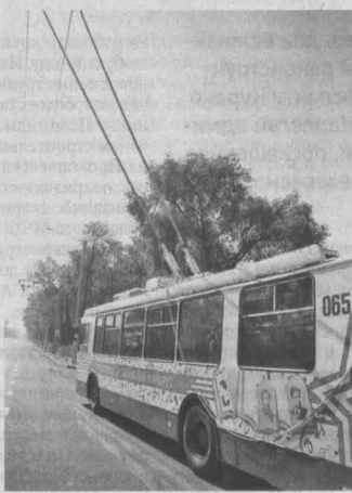
По проспекту Курако теперь будет курсировать троллейбус.

Еще одна задача, поставленная Аманом Тулеевым: к 2020 году выйти на 100-процентное обеспечение Кузбасса собственным мясом. Сегодня потребность в мясе закрыта только на 70%.