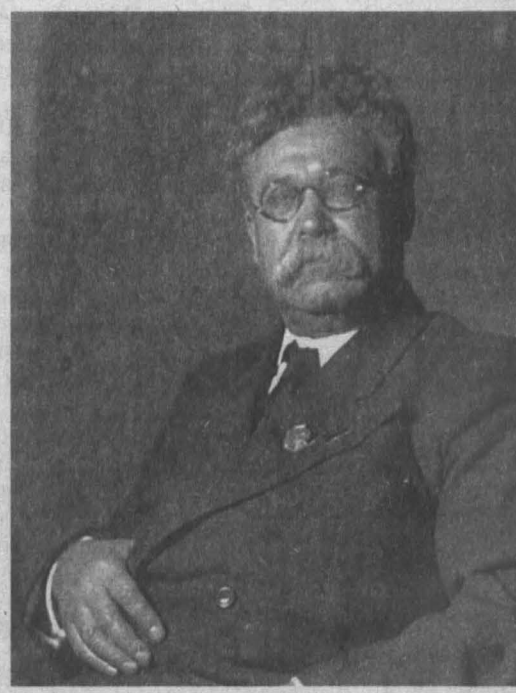
Советский академик Емельян Ярославский, помогший выделить Кемеровской области из состава Новосибирской.

«Сегодня многие пытаются переписать историю в угоду собственным интересам, но благодаря кропотливому изучению исторических свидетельств история предстает перед нами во всей красе и мельчайших подробностях и порой преподносит сюрпризы. Например, из письма Емельяна Ярославского нам теперь известно, что еще в 1942 году поднимался вопрос о добыче из угля жидкого топлива, хотя это принято считать достижением современных технологий», - сказал Аман Тулеев.