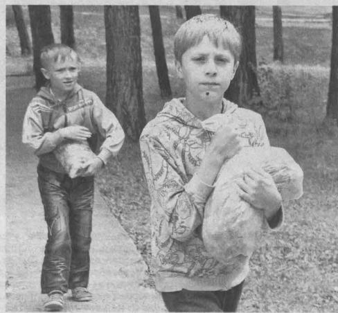
Честно заработанная «валюта».

И вообще бодрость в тот день я ощущала всюду. Двадцать два года лагерю. Так что он во всех отношениях моло-