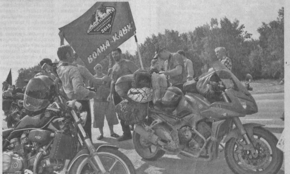
«ВОЛНА ПАМЯТИ» – так называется мотопробег, участники которого вчера прибыли в Кемерово. Он посвящен всем мотоциклистам, погибшим в дороге. Это своего рода эстафета – от города к городу, от мотоклуба к мото клубу, которая образует своеобразный «коридор дружбы и безопасности». Идея «двухколесного» пробега родилась в 2010 году после убийства нижегородского мотопутешественника... Ныне одна колонна байкеров стартовала из Калининграда, другая – из Санкт-Петербурга. Они доедут до Находки и вернутся обратно. Несколько кемеровских байкеров также присоединились к движению.