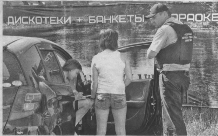
Повстречать на пляже «людей в форме» должники явно не ожидали...

Ждать долго не пришлось: возле одной из «ла-