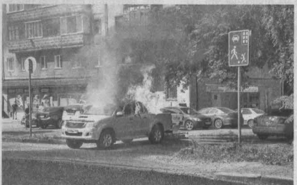
Отремонтировать эту иномарку уже не получится.