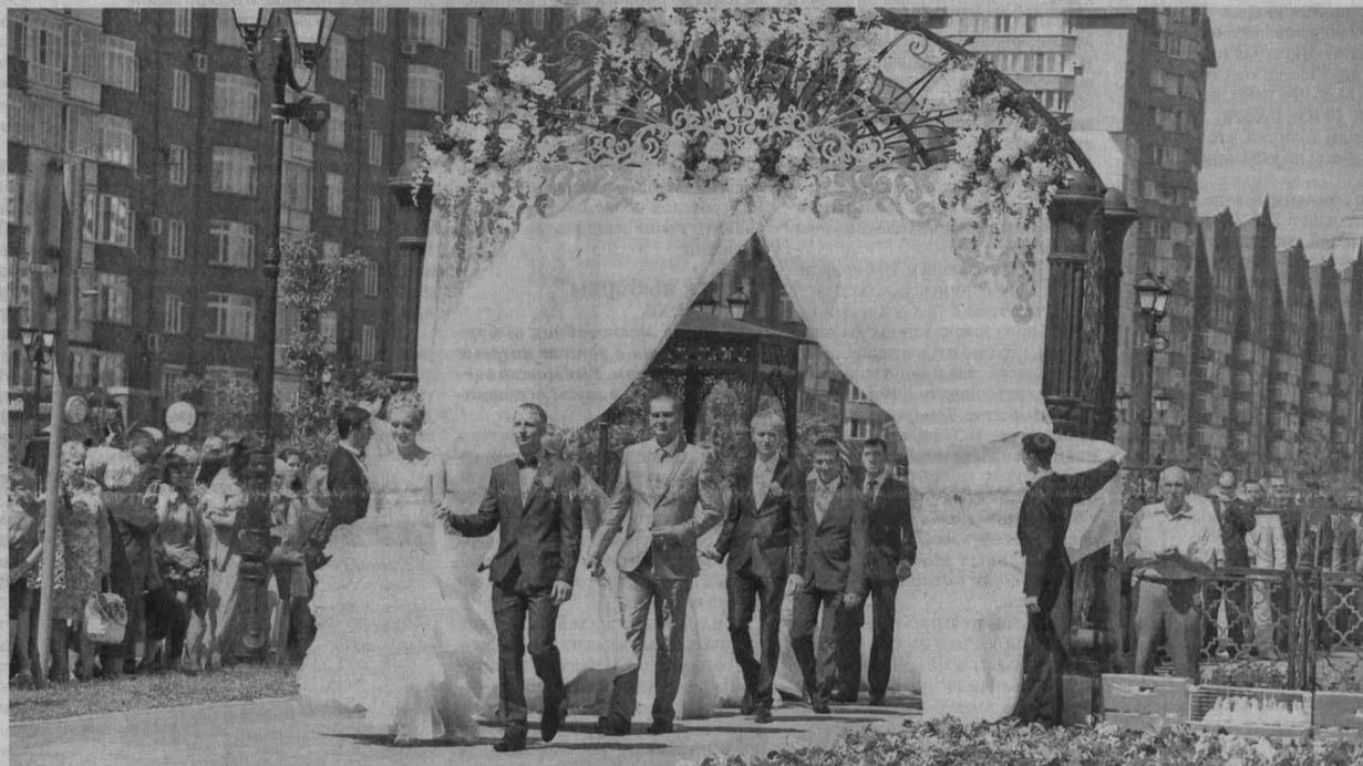
Молодожены получили льготные кредиты на покупку квартиры на 20 лет без процентов и первоначального взноса. Уже в первом квартале 2016 года они смогут отпраздновать новоселье.

Накануне Дня металлурга Аман Тулеев два дня работал в Новокузнецке, где принял участие в торжествах по случаю праздника, открыл новый ЗАГС и вручил новокузнецчанам палки для скандинавской ходьбы