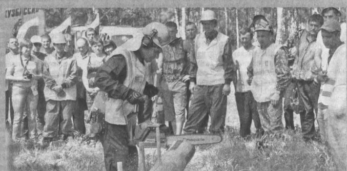
Все задания моделировали реальные ситуации, с которыми лесорубы сталкиваются в повседневной работе.