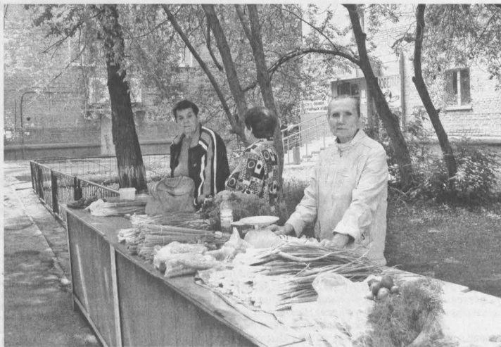
На этот рынок (ул. Леонова, 13) надо приходить со своим стулом.

Р.С. Пока этот материал готовится к печати, стало известно, что на улице 40 лет Октября открыли ещё одну торговую точку для садоводов и огородников. Здесь плату за место не берут. Уважаемые продавцы надеются, что подобных точек — благоустроенных и цивилизованных — в Кировском районе будет больше. И у покупателей тоже будет выбор, где покупать и почём.