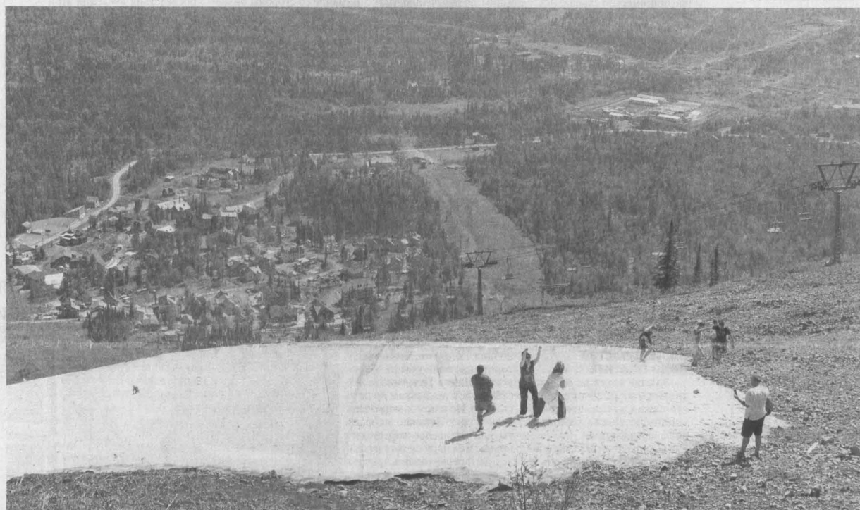
В перспективе в развитии Шерегеша будет сделан акцент на всесезонность.

Аман Тулеев предложил поддержать проект строительства дороги, соединяющей федеральные трассы М-52 и М-54