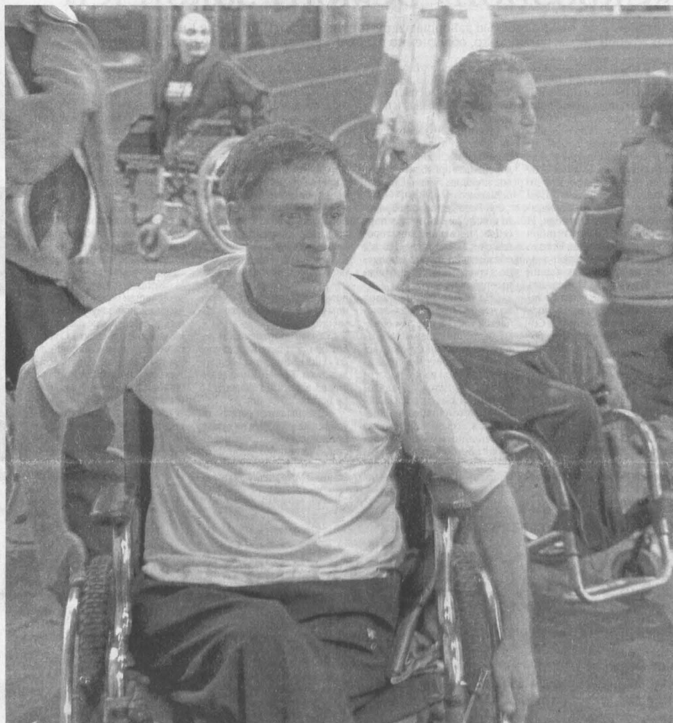
В Кузбассе действует уникальная система мер социальной поддержки. В том числе много делается для людей с ограниченными возможностями здоровья – для их социальной реабилитации.

Вчера Аман Тулеев озвучил новые меры социальной поддержки для кузбассовцев