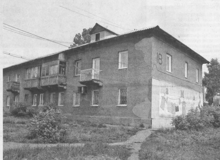
Дом №18 по улице Луначарского все не «безнадежен».