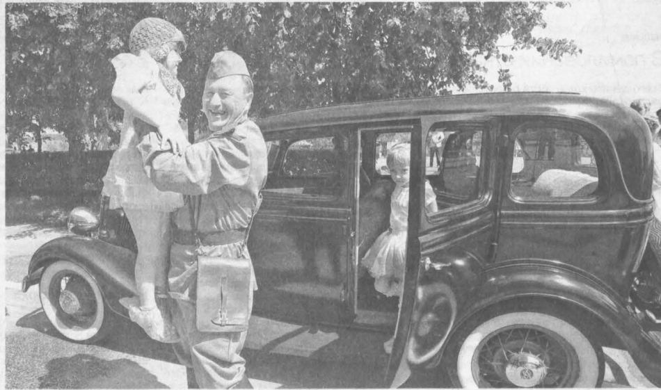
РЕТРОКАР ПРОТЕСТИРОВАЛИ. На Притомской набережной Кемерова состоялась презентация-прогулка на раритетном автомобиле Ford-40 Model V8. Напомним, по решению Амана Тулеева эта уникальная машина 1943 года выпуска передана отделу военной истории областного краеведческого музея, чтобы бесплатно катать детей. Кстати, на подобных авто с начала войны ездил командный состав Красной Армии, в том числе маршал Победы Георгий Жуков. Первые участники интерактивного проекта не только протестировали новый маршрут выходного дня, но и осмотрели мотор машины, ходовую часть и, конечно, сфотографировались на ее фоне на память.