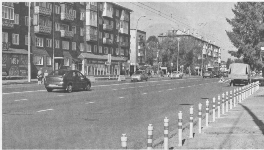
Теперь остановки общественного транспорта отделены от дороги специальными столбиками.