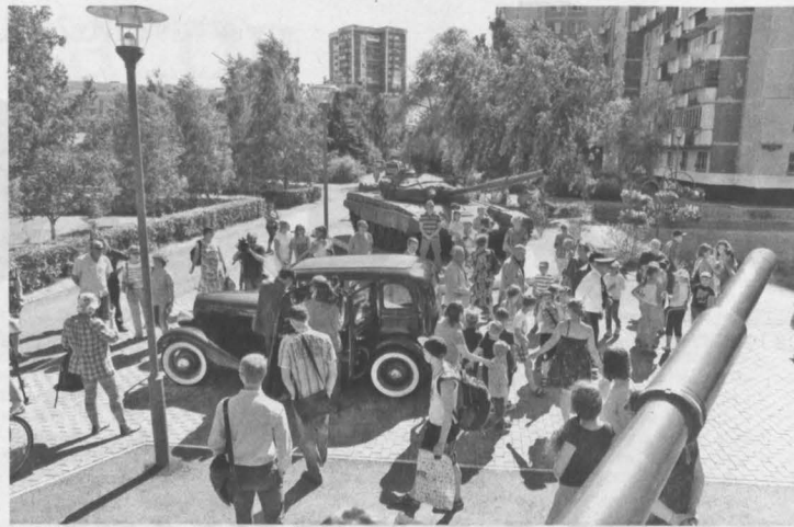
«Форд», за рулем которого будет водитель в военной форме 40-х годов, начнет отправляться по экскурсионному маршруту от входа в музей.