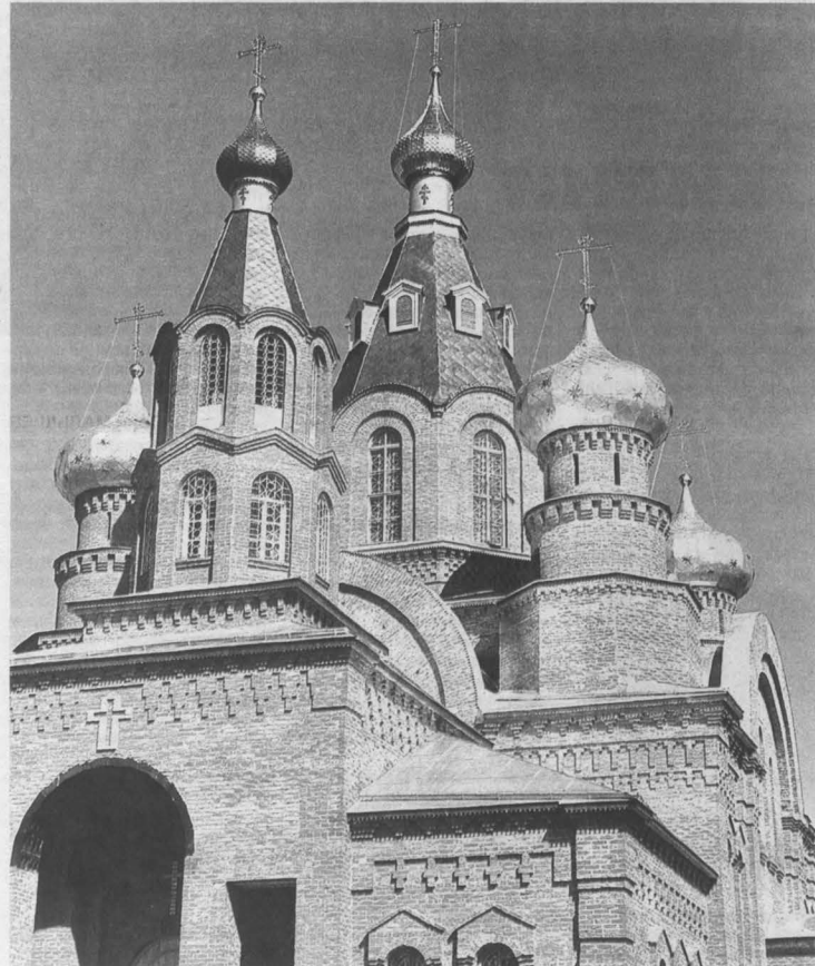
Юрга. Кафедральный собор во имя Иоанна Предтечи.