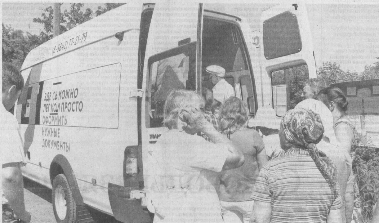
Мобильный офис МФЦ «Мои Документы» консультирует дачников по всем интересующим вопросам.

После обращения Амана Тулеева к дачникам кузбассовцы стали активнее заниматься приватизацией своих земельных участков