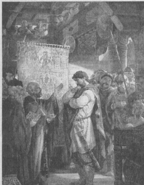
28 июля – день памяти равноапостольного великого князя Владимира, во Святом Крещении Василия (1015 год). Алексей ФИЛАТОВ. «Выбор веры князем Владимиром».