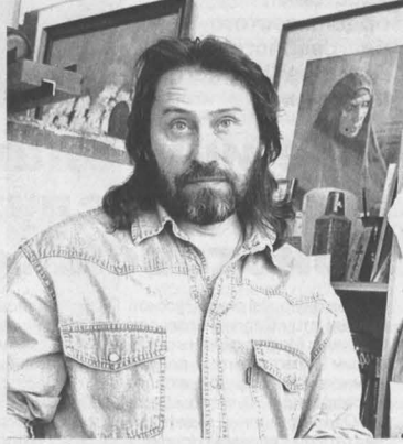
На снимках: икона Божией Матери «Покров над землей Кузнецкой», художник Леонид Ключников.