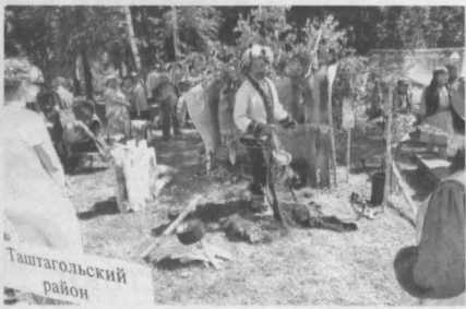
Повеселились в этот день от души!