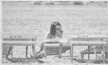
Отдых у воды должен быть безопасным.