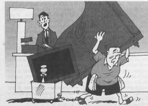
Рисунок Андрея Горшнова.

Отмечен в истории индустрии гостеприимства и такой инцидент, когда была украдена собака хозяйина отеля. Но самая наглая кража, без сомнения, была зафиксирована в одном из американских отелей сети Holiday Inn. Приезжая пара специально попросила номер около автостоянки. Гостям пошли навстречу, а они дочиста опустошили предоставленную им комнату, погрузили все вещи на припаркованный на стоянке грузовик и скрылись в неизвестном направлении.