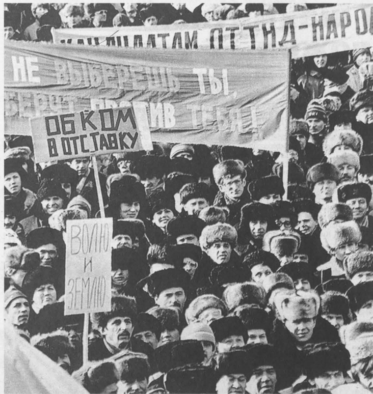
Многотысячные митинги, состоявшиеся накануне намеченных на 4 марта выборов народных депутатов, прошли практически во всех городах Сибири. Призывы голосовать за демократов подкреплялись требованиями отправить обкомы КПСС в отставку.