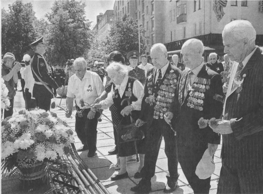
■ Уже по традиции приходят в этот день ветераны к Вечному огню...