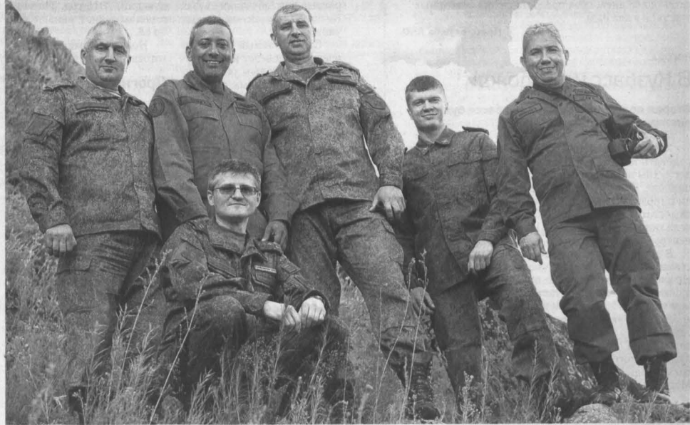
«ТУРИСТЫ» В КАМУФЛЯЖЕ. В Юргу приехали военные из Венесуэлы. В минувшие выходные на местном полигоне прошли учения артиллеристов. Кроме того, для гостей из Латинской Америки провели экскурсию по живописным местам. Там, особенно заинтересовали их наскальные рисунки, расположенные на Тутальских скалах. Долго разглядывали они изображения животных и людей, стараясь запечатлеть их в подробностях на фотокамеры. Кто-то вспомнил о древних наскальных росписях в Венесуэле, пытаясь провести связь времен и народов планеты.