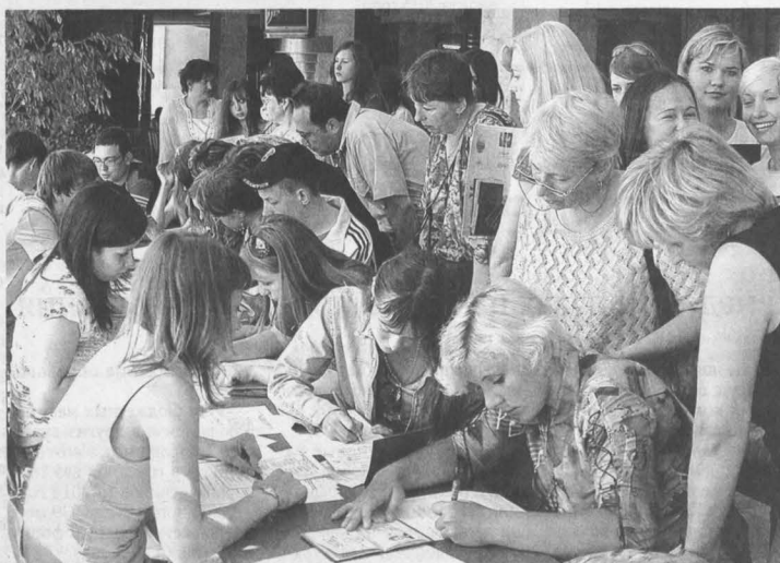
■ Горячая пора для абитуриентов только началась.