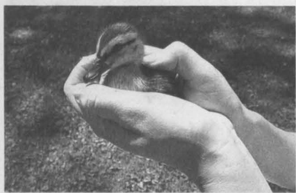
■ Как только птенчик подрастет, его выпустят на волю.