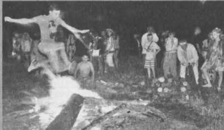
Репетиция перед Купальской ночью.

В городе прошел фестиваль «Сотворение. Купальская ночь».