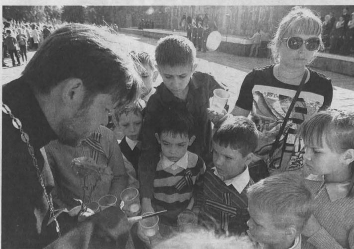
■ Новокузнецкие приняли участие в акции «Свеча памяти».