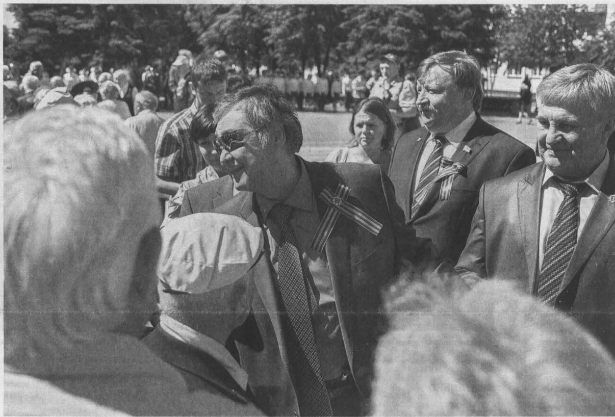
Аман Тулеев принял участие в памятных мероприятиях.

В Кузбассе прошли мероприятия, посвященные 74-й годовщине начала Великой Отечественной войны. В Кемерове Аман Тулеев и ветераны возложили цветы к памятнику воинам-кузбассовцам