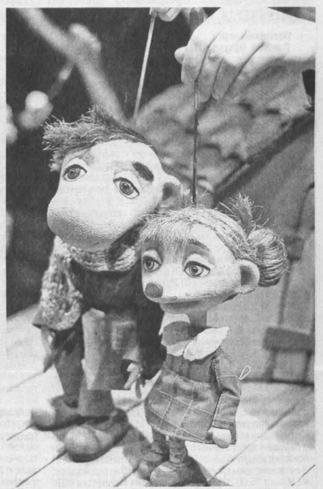
Сцена из спектакля «Белка и пумпурум».