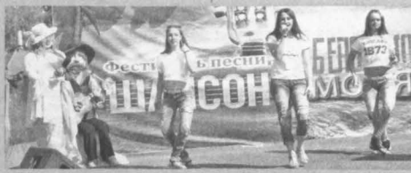
Фестиваль «Шансон у моря», помимо всего прочего, еще и привлекает туристов отдыхать на Беловском водохранилище.

За 15 лет существования фестиваль стал традиционным и ежегодно проводится на начало открытия местного купальского сезона. Кемерово, Новокузнецк, Белово, Мыски, Березовский, Прокопьевск, Ижморский район – вот «география» тридцати