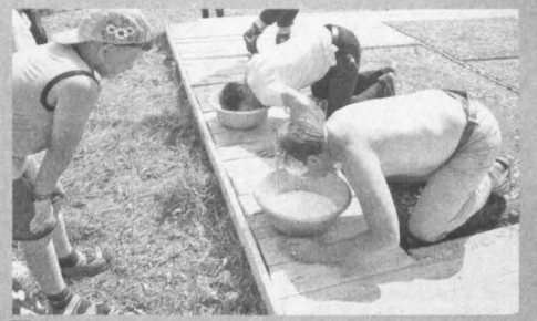
Все присутствующие на сабантуе могли не только послушать национальные татарские песни, поболеть за красочными танцами, но и стали участниками конкурсов.