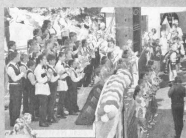
Участники флешмоба пели так, что их слышал весь центр Кемерова.

Здесь состоялся хоровый фестиваль «Тебе, Россия, песню пою!». В нем участвовали около