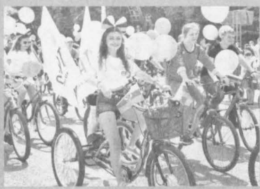
Видео с велопробега посмотрели уже тысячи пользователей интернета.

Старт был дан на площади Советов, от нулевого километра. Участникам предстояло проехать в праздничной колонне по центру города. Принять участие в велофесте мог каждый желающий. Своих «железных коней» велосипедисты представили во всей красе: привязали шар-