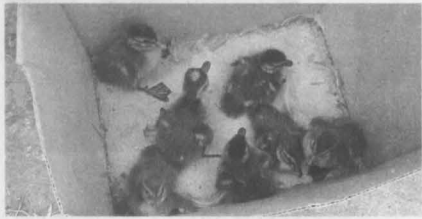
Утята чуть не попали под колёса машин.