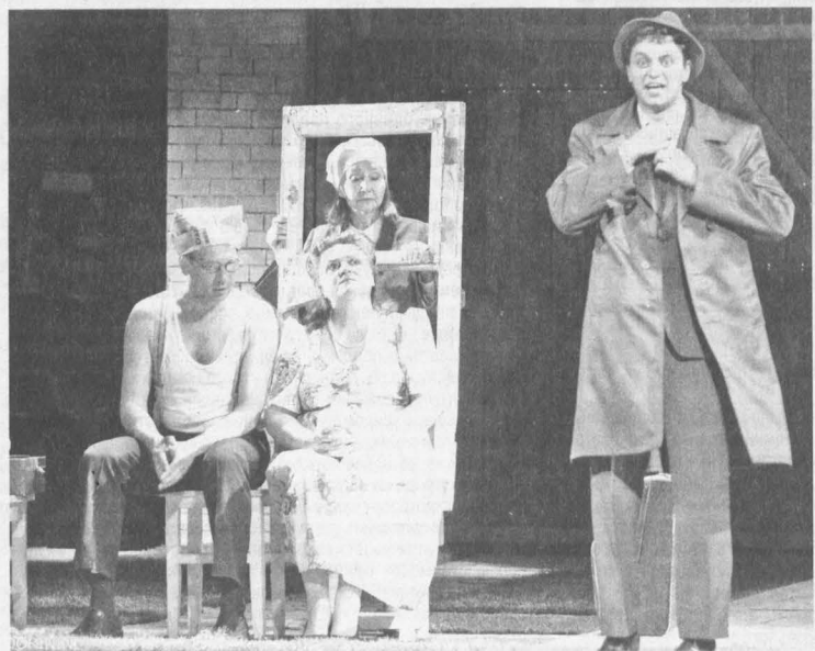
Сцена из спектакля «Фронтотвичка». Фото Николая Федорина.