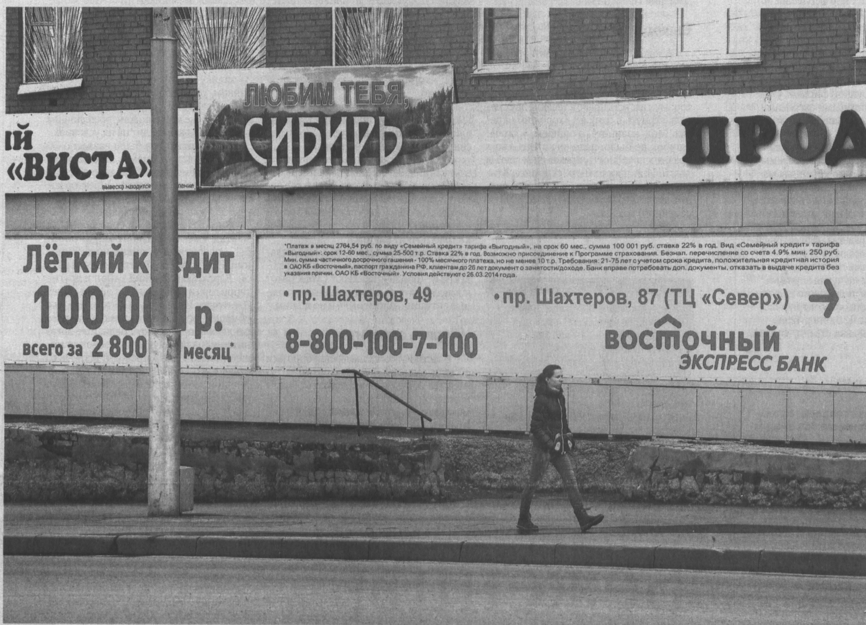
Агрессивная реклама - одна из причин кредитомании.

Кредитоманию можно «излечить» только активным вмешательством