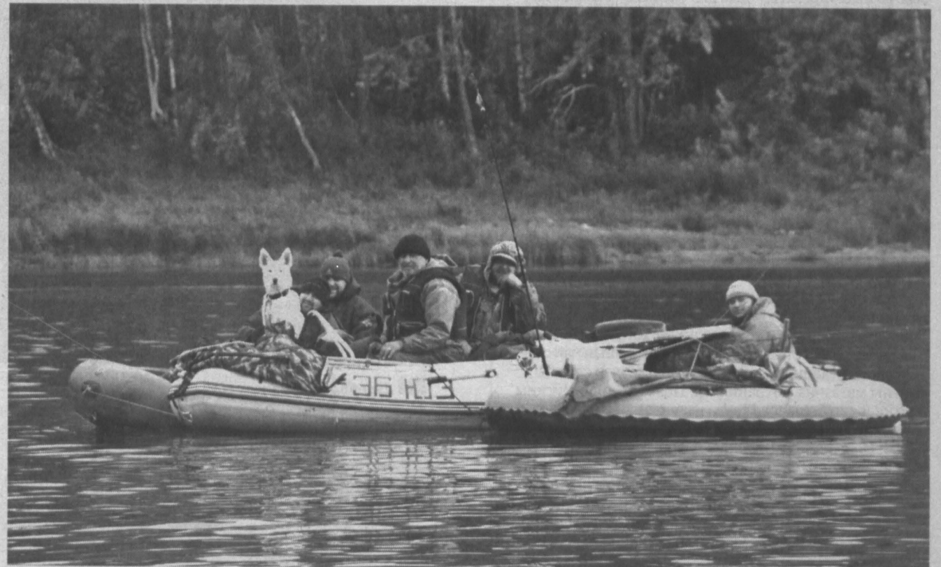
■ БЕЗОПАСНОСТЬ НА ВОДЕ. В Кузбассе с началом навигации возобновила работу экзаменационная комиссия по аттестации водителей маломерных судов. С заявлениями о допуске к сдаче экзаменов уже обратились более 150 человек. Среди них новички, а также те, кто меняет права. Кстати, они выдаются сроком на 10 лет. Аттестация судоводителей проходит в Кемерово, Белове, Новокузнецке, Полысаеве. Также в этом году планируется проведение выездных заседаний комиссии в Таштагольском районе, Мысках и Маринске. Всего же в Кузбассе около 13 тысяч владельцев маломерок.