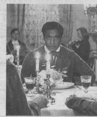
Чиветел Эджифор в фильме «12 лет рабства».