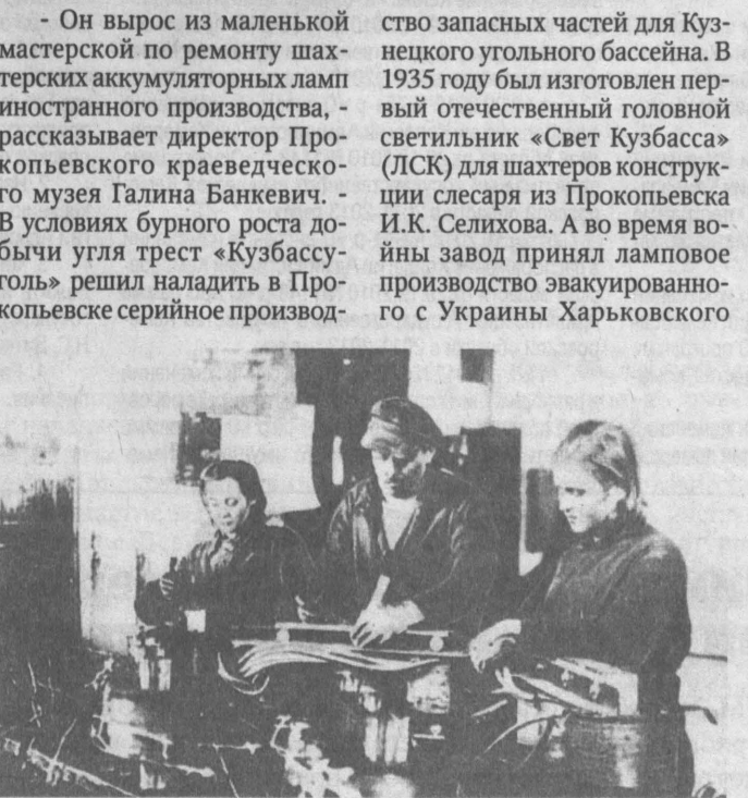
Сборка трансформаторов ТЩС.