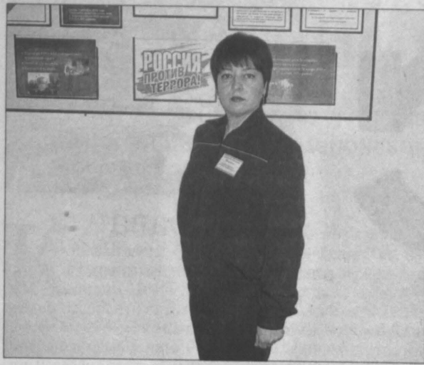
Так выглядит форма учителей ОБЖ.