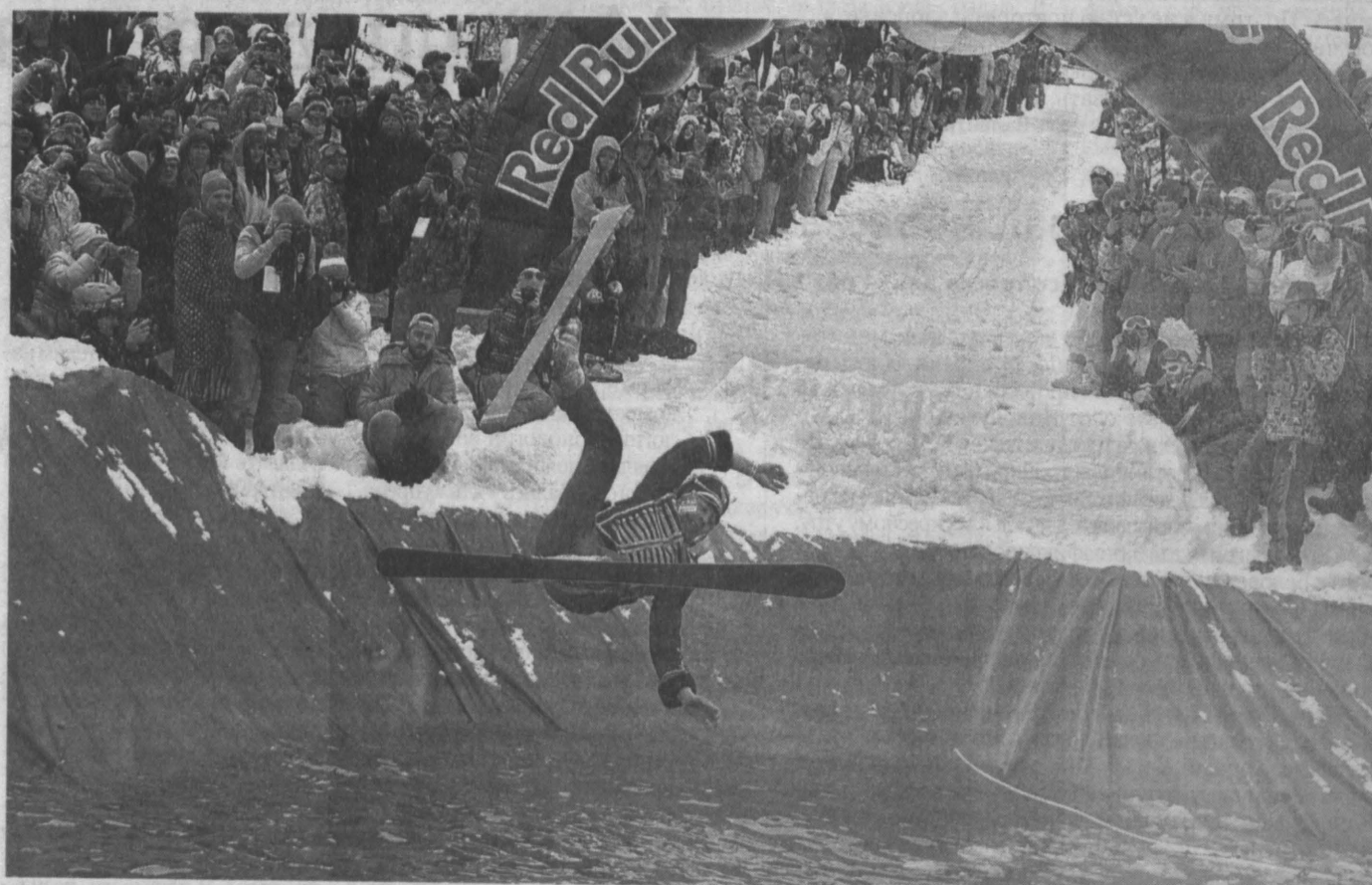
ПРЫЖОК ПО-ГУСАРСКИ. Прыжки лыжников и сноубордистов с трамплина в бассейне в костюмах стали кульминацией праздника в Шерегеше. На что отважились всего несколько десятков человек. В отличие от массового спуска в карнавалных костюмах и купальниках. По данным организаторов, в спуске приняли участие более 1300 человек со всей России. Спуск имеет все шансы попасть в Книгу рекордов Гиннеса, так как ранее рекорды по массовому спуску в карнавалных костюмах не регистрировались.