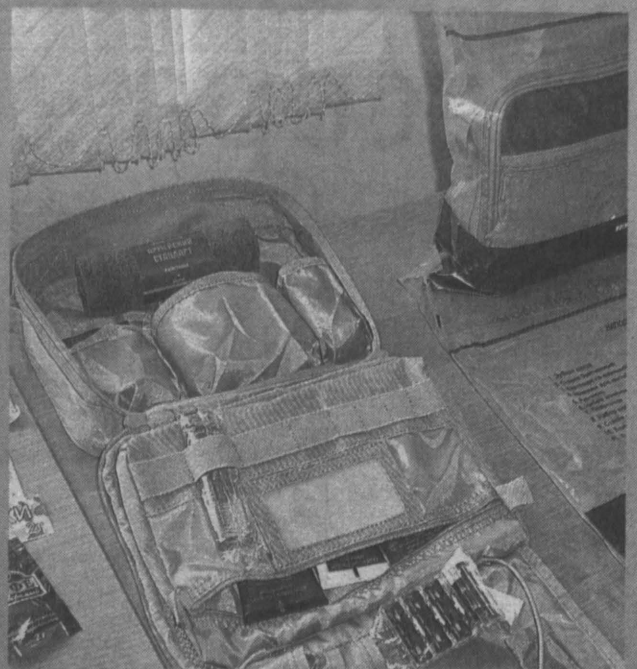
солдатский сухой паек (коробка на 1 сутки):

складная зубная щетка, зубная паста, бритвенный станок (с тремя запасными кассетами), шпички для ногтей, гели для и после бритья, расческа, швейный набор, полотенце, набор пластырей, гигиенический бальзам для губ, шампунь-гель, роликовый дезодорант, гель для стирки, гель для рук с витамином Е, крем для рук, гигиенический крем для ног, силиконовый стакан с крышкой – всего 19 наименований (для офицеров дополнительно предусмотрены туалетная вода и складной нож).