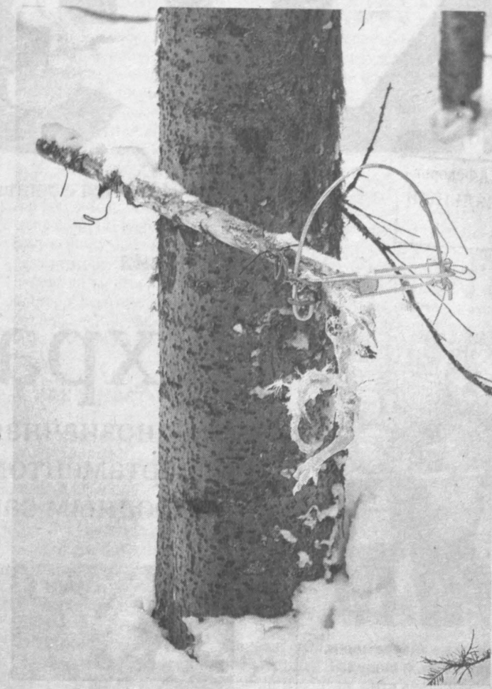
Охотничий сезон закрыт, а капкан еще стоит.

– Положение об охранной зоне заповедника было утверждено в 90-е годы, в то время всё решалось на местном законодательном уровне. Да, там прописано, что мы должны выдавать разрешения на охоту после согласования с админист-