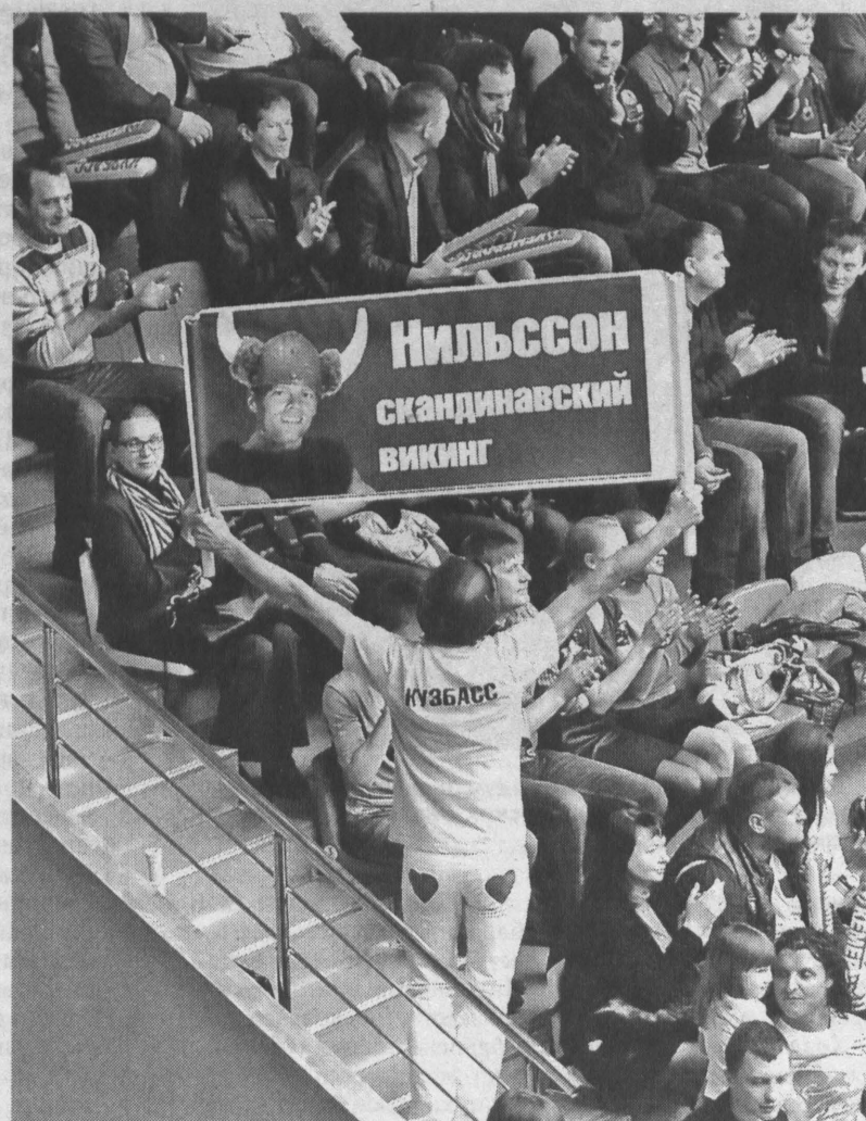
Болельщики «Кузбасса», по обыкновению, заполняют спорткомплекс «Арена».