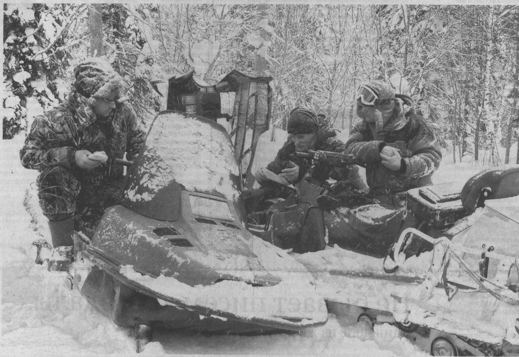
Охотник или браконьер? Лицензия есть, разрешения нет...

Неоднозначная законодательная ситуация становится яблоком раздора между департаментом охраны объектов животного мира Кемеровской области и государственным природным заповедником «Кузнецкий Алатау».