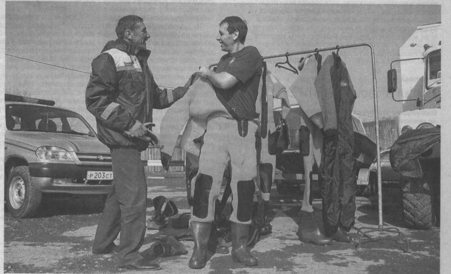
ГОТОВНОСТЬ №1. Вчера на озере Красном в Кемерове прошел смотр техники, личного состава служб экстренного реагирования области и службных собак, которые будут задействованы в мероприятиях по безаварийному пропуску ледохода и паводковых вод на территории Кузбасса.