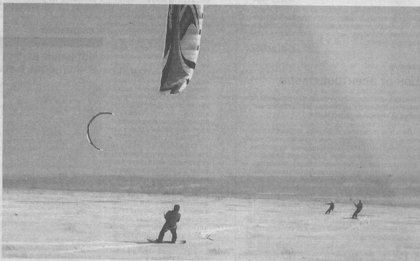
УПРАВЛЕНИЕ ЗМЕЕМ – ПОЛНЫЙ КАЙТ. Теплая погода, ветер и снег – наиболее подходящие условия для кайтеров, у которых сейчас самый разгар сезона для катания. Кайт еще называют управляемым воздушным змеем, с помощью которого можно передвигаться по воде, по снегу, по земле, используя любые скользкие средства. Зимой, например, это сноуборд или лыжи. Сегодня, по словам кайтеров, их в области всего несколько десятков человек, но кайтинг постепенно набирает обороты. О том, почему это не просто спорт, но и философия, «Кузбасс» расскажет в одном из последующих номеров. Оксана Панарина.