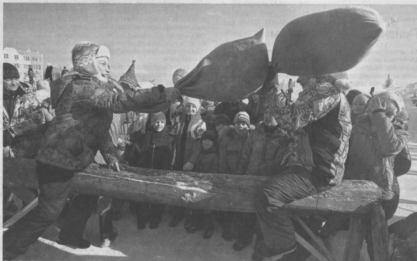
«ЭХ ДА МАСЛЕНИЦА!» В выходные кузбассовцы дружно встречали и провожали Масленицу. Во всех городах и районах, такие как и в Кемерове, прошли народные гуляния, которые сопровождались разными представлениями и играми. Излюбленные развлечения – померяться силой и сноровкой в лазаньи по столбу, подтягиванию каната и многих других состязаниях. Но главные атрибуты праздника – сожжение чучела Зимы и угощения: много-много вкусных блинов...