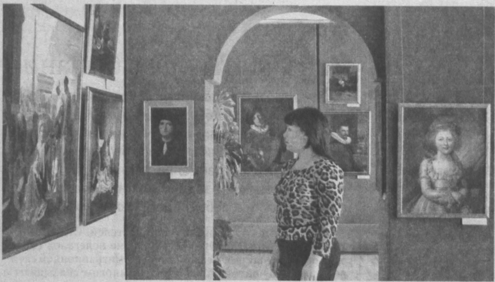
Копийные работы из Эрмитажа вызывают неподдельный интерес.