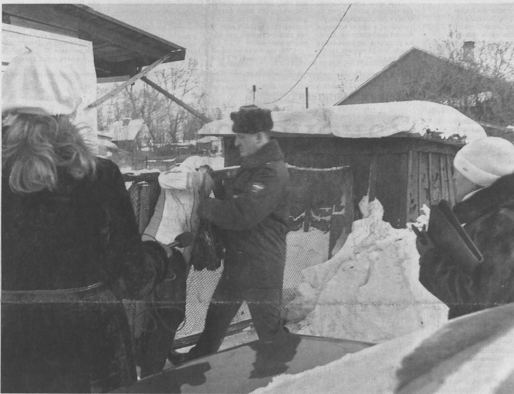
А здесь хозяйка набросилась на стражей порядка.

В муниципальных образованиях Кузбасса идут тотальные проверки собственников жилья на предмет фиктивных прописок. В Кемерове на основании предварительно собранной информации рейды по домам проводят «сборные команды» полицейских, сотрудников администрации, миграционной службы, коммунальщиков и общественныхников.