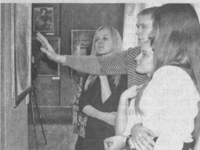
Будущим живописцам есть что обсудить.