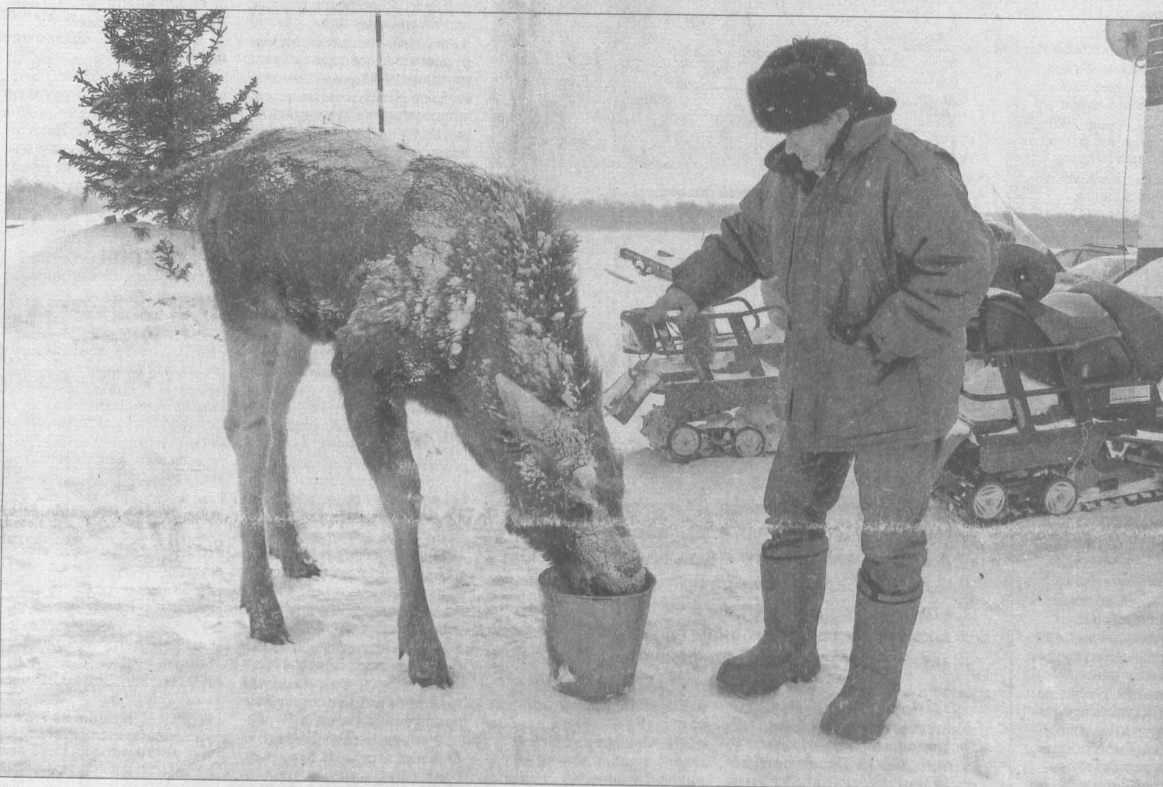
Мальчик чувствует себя свободным. Иногда даже слишком...

Порой их искренне хотят спасти, создавая при этом проблемы и себе, и самим зверям