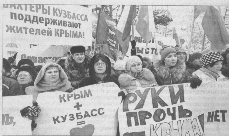
Ситуация на Украине мало кого оставляет равнодушным. На митинге люди поддержали русскоязычное население этой страны и высказались против экстремизма.