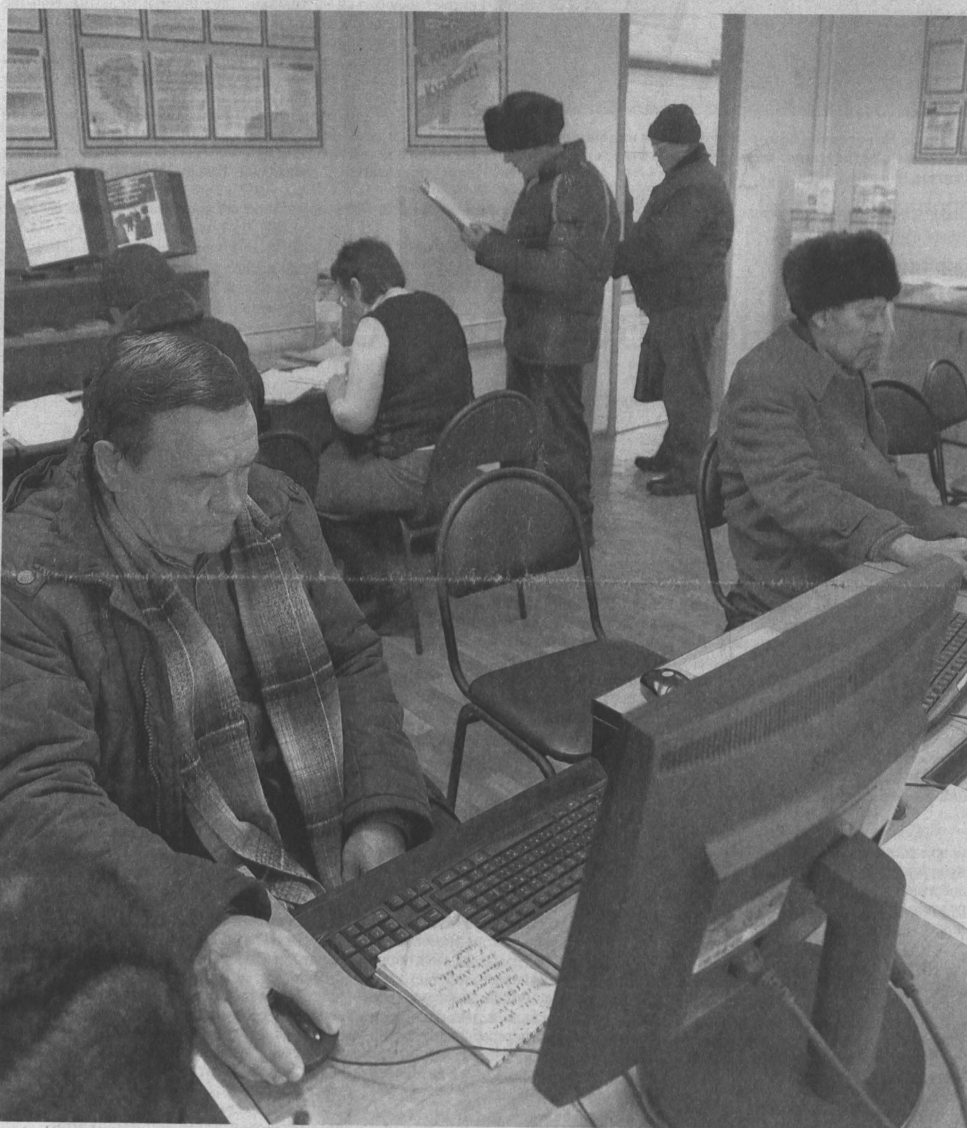
Люди «третьего возраста» в поисках работы не менее активны, чем молодые.

В центрах занятости населения Кузбасса начала работать программа переподготовки и обучения пенсионеров, желающих возобновить трудовую деятельность