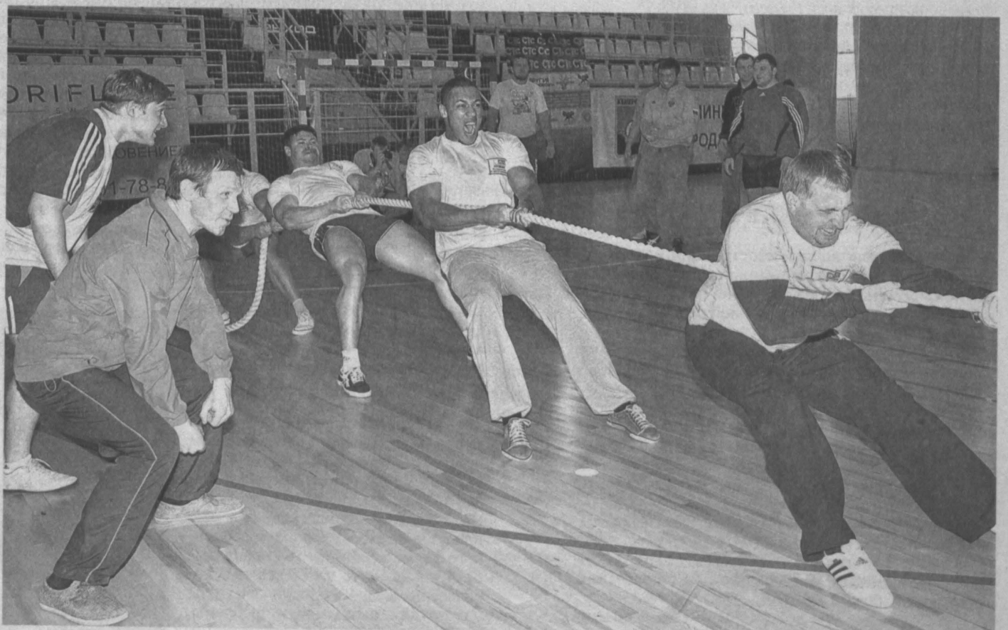
БОРУНЫ-ДОБРУНЫ. В Кемерове состоялся II Открытый турнир по перетягиванию каната, в котором участвовали команды крупных предприятий и организаций со всей области. Он проводился по олимпийской системе до двух поражений. И не случайно, ведь еще в начале XX века этот вид спорта был олимпийским (в составе легкой атлетики). В итоге первое место у рязреца Инской (Беловский р-н), на втором - ЦОФ «Беловская», на третьем - команда борцов-вольников ГКЦ «Кузбасс» «Борунь-добрунь».