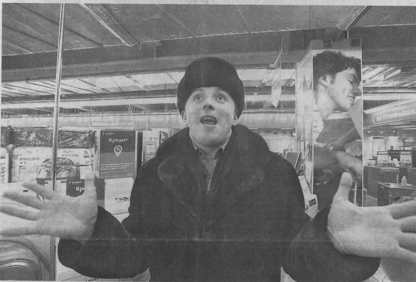
Кредит: потом мне будет худо, но это ведь потом...

Закредитованность кузбассовцев в 3,3 раза превышает плановые расходы областного бюджета на 2014 год