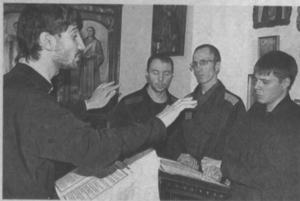
Тюремный церковный хор на литургии для осужденных.