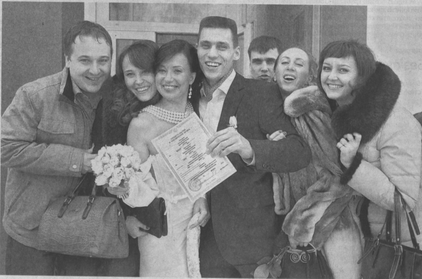
В ДЕНЬ ВЛЮБЛЕННЫХ. Вчера в Кузбассе 317 пар молодоженов официально узаконили свои отношения. В прошлом году 14 февраля пришлось на середину недели, поэтому лишь 140 пар поставили штамп в паспорте. Между тем сотрудники управления ЗАГС по Кемеровской области отмечают, что в последнее время не только в Кузбассе, но и в России становится модным жениться также 8 июля, в День семьи, любви и верности, и весной, после окончания Великого поста.