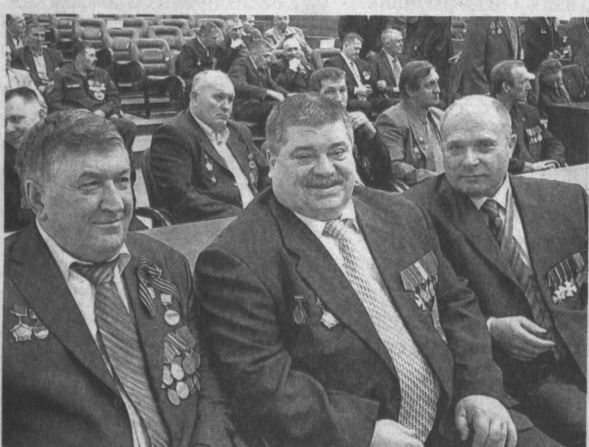
Ветераны афганской войны на губернаторском приеме.