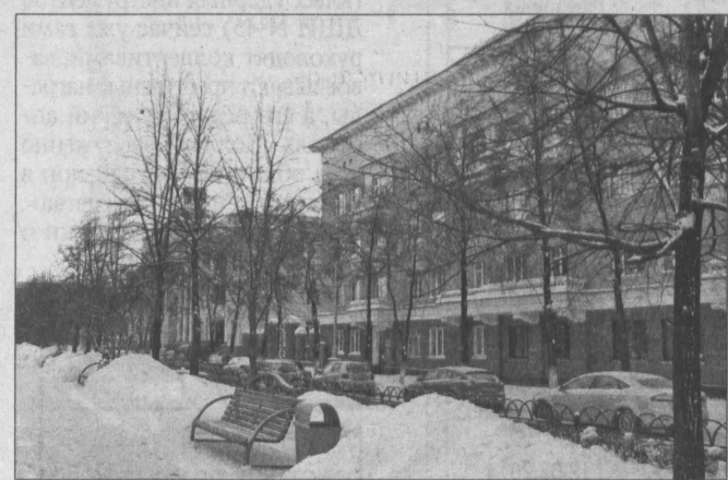
Этот дом стоит рядом с мэрией Кемерово. И жильцы надеются на более добрососедские отношения...

Эти цифры (какие верные?) мы можем визуально проверить, а как остальные проверить, внутри отчета? Достоверность актов выполненных работ, услуг и необходимость проделанной работы. Просили начальника РЭУ-9 (письменно), чтобы при подписании актов присутствовал представитель совета дома. Подписали только акт по замене окон в шести подъездах нашего дома в 2013 году, т. к. занялись этим вопросом сами, по просьбе наших жителей. Остальные окна будем менять в 2014 году – из-за нехватки средств. Подъезды