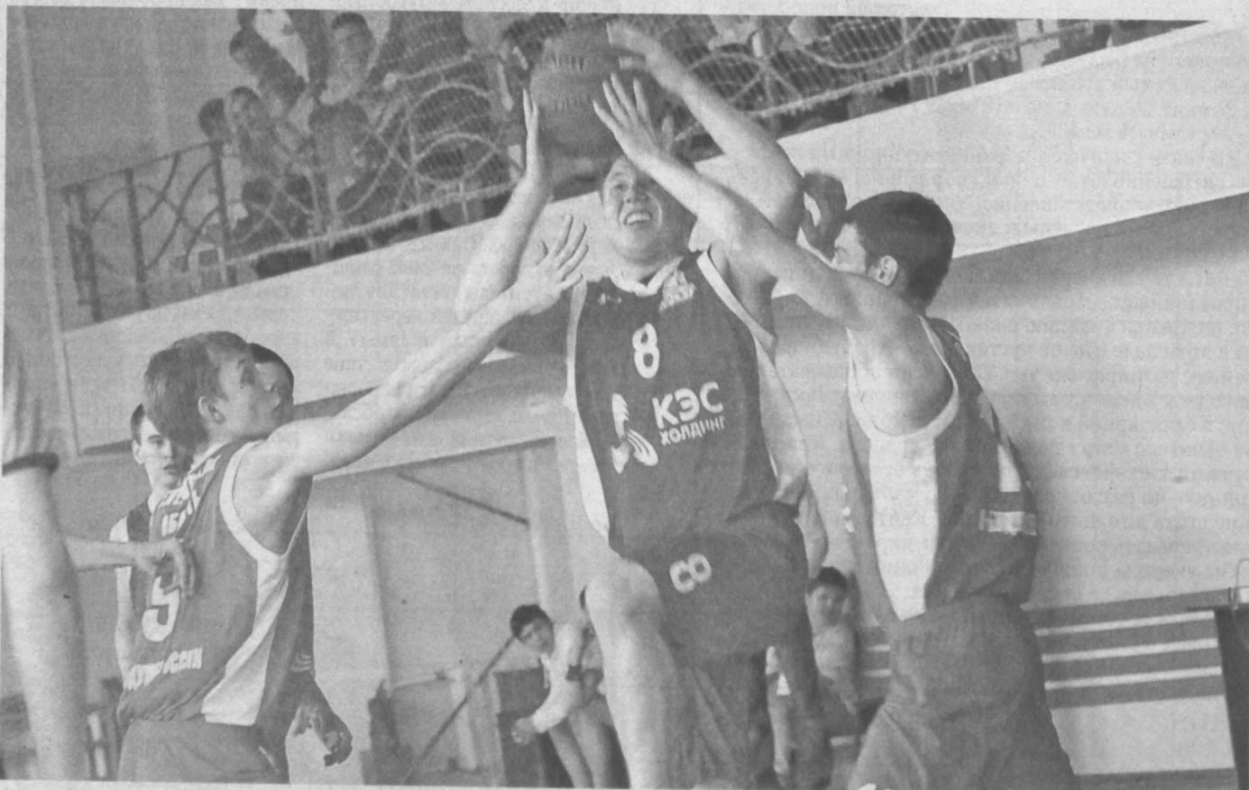
ФИНАЛ БАСКЕТ-СЕЗОНА. Вчера в спорткомплексе «Кировец» в Кемерове прошел финал городского чемпионата школьной баскетбольной лиги «НЭС-БАСКЕТ» сезона 2013-2014 гг., в котором приняли участие 28 юношеских команд и 18 команд девушек из 34 школ. Победителями стали женская команда школы №48, среди юношей – команда гимназии №17. Они получили право сыграть в финале чемпионата Сибири и Урала, который пройдет в Барнауле с 9 по 13 марта.