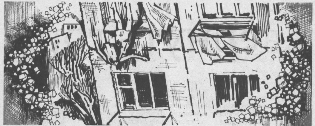
ИЗ ЗАЛА СУДА