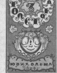
Издание 1930 г. с иллюстрациями Мстислава Добужинского.

Юрий Олеся. Три толстяка. Роман для детей. М., Л.: «Земля и фабрика», 1928.