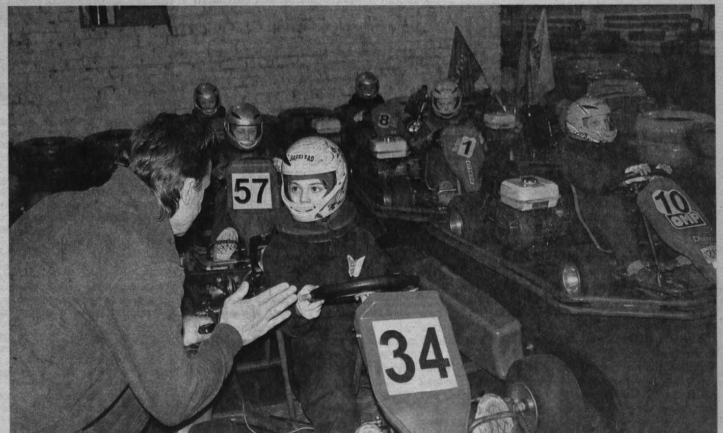
ПРЕДПРАЗДНИЧНАЯ ГОНКА. Прокатились с ветерком на картах воспитанники детского дома №2 – такую акцию для ребятшек уже несколько лет подряд устраивают кемеровские предприниматели, занимающиеся автомобильной диагностикой, автомеханикой и автогонщиками. Сначала инструктаж, ну а потом и сама поездка. За безопасностью следят инструкторы. Цель таких мероприятий – занять детей интересным делом. Ведь машины всегда интересны мальчишкам, кстате, по этой части им не уступают и девочки, которые наравне с ними соревновались. А потом все получили грамоты и подарки.