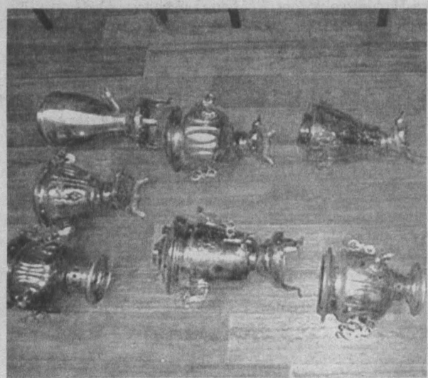
Самовары из коллекции для будущего музея.