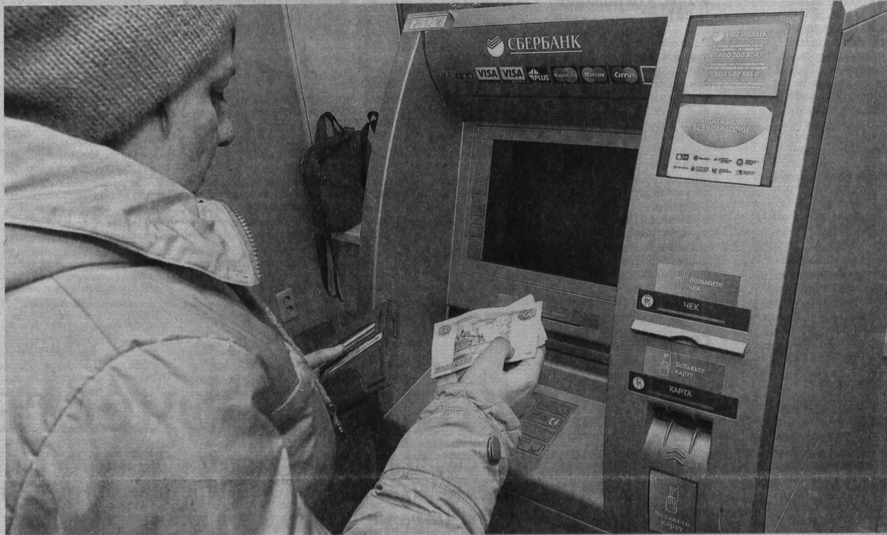
Журналисты «Кузбасса» на собственном опыте убедились: деньги банкоматы Сбербанка выдают.

В Кемеровском отделении Сбербанка опровергли слухи о якобы возможной блокировке карт и нехватке денег в банкоматах