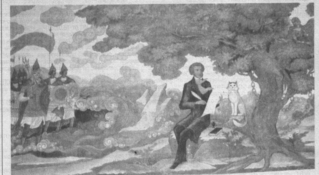
В таких стенах особенно приятно заниматься творчеством.