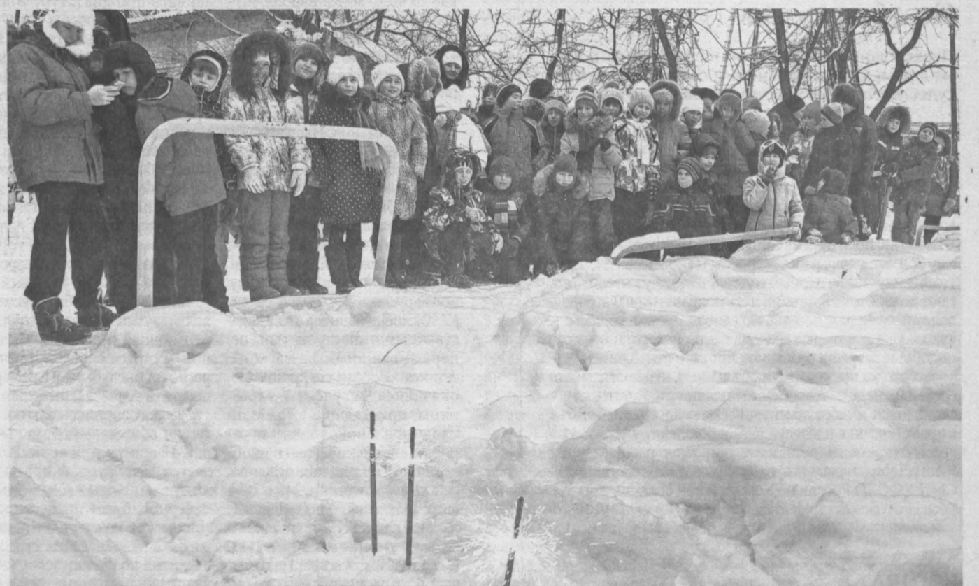
ПРАВИЛЬНЫЙ ФЕЙЕРВЕРК. В Кемерове в преддверии новогодних праздников сотрудники городского Госпожнадзора проводят уроки безопасности для школьников младших классов. «Бомбочки», хлопушки, петарды, бенгальские огни – популярные зимние забавы ребятшек, обращение с которыми требует определенной осторожности и сноровки. Специалисты ведомства не только объяснили школьникам, на что им следует обращать внимание при покупке пиротехники, но и провели наглядные занятия по использованию фейерверков.