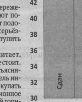
Средняя цена предложения 1 кв. м в зависимости от этапа строительства, сентябрь 2014 г. (тыс. руб.)

Сейчас, чтобы уберечь сбережения, одни эксперты предлагают покупать жильё. Другие советуют подождать, потому что возможна серьёзная просадка цен. Как же поступить простому покупателю?