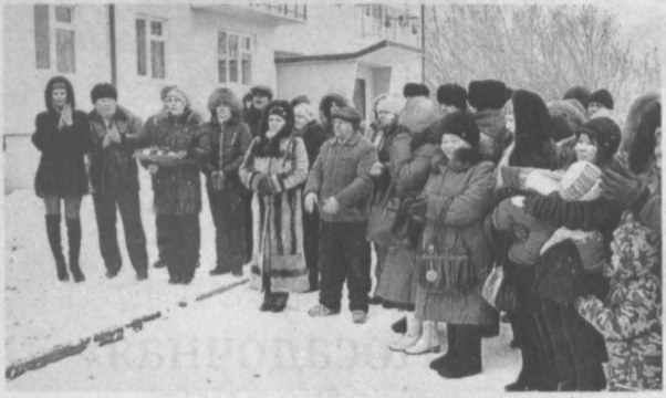
Новоселы получают ключи от новых квартир.