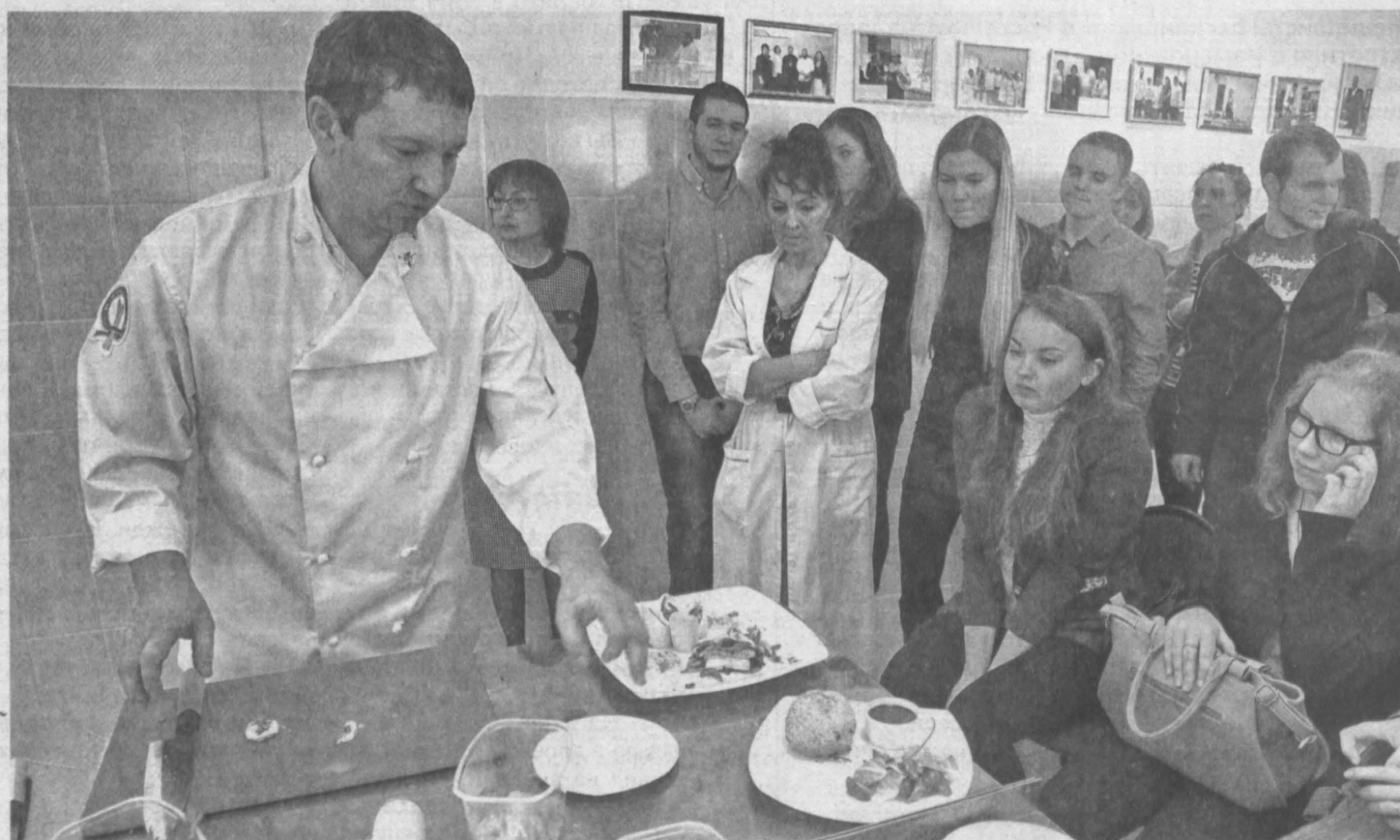
ФЕСТИВАЛЬ ЕДЫ. В Кемерове, в культурном центре русской кухни, открывшемся этой осенью при Кемеровском технологическом институте пищевой промышленности, прошел финал конкурса научно-исследовательских работ «Русская кухня: история и современность» среди студентов этого вуза, местных школьников, а также ребят с профильных кафедр Красноярска, Новосибирска и Екатеринбурга. Помимо презентации и защиты проектов молодежи, на «фестивале русской еды» давали мастер-классы по приготовлению блюд из курицы и тыквы известные российские шеф-повара.