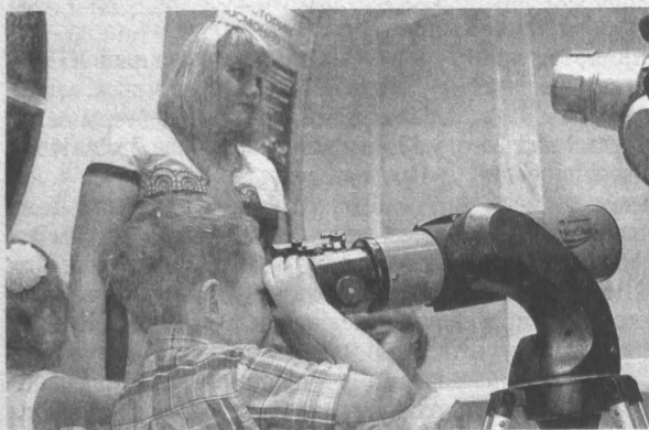
Юные астрономы будут изучать солнечную систему.