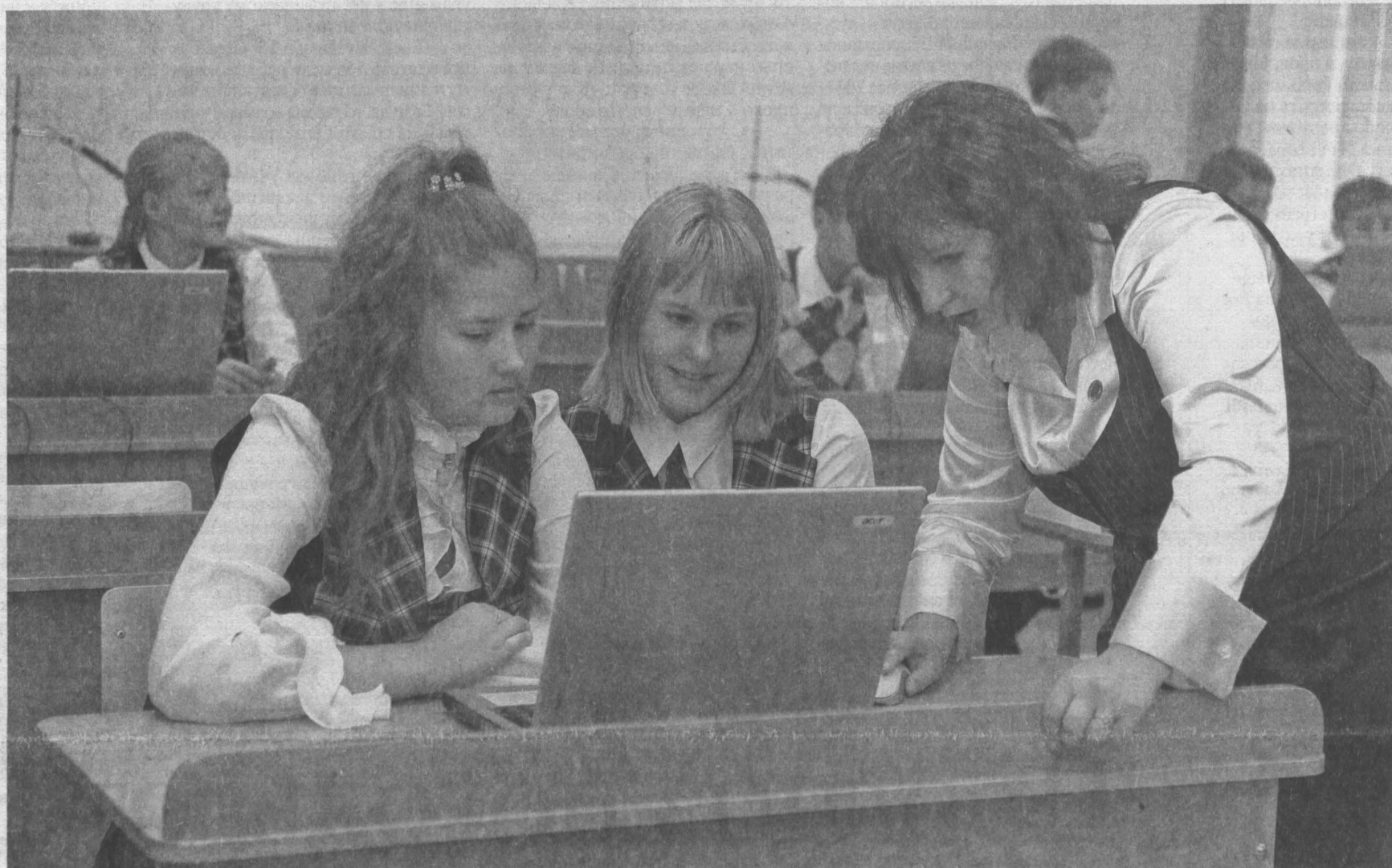
Компьютеры и интерактивные доски облегчают обучение. И все же главное в образовании – личность учителя.

В последнее время школьных учителей всё чаще стали спрашивать по поводу школьных реформ. И на уровне страны, и на уровне области