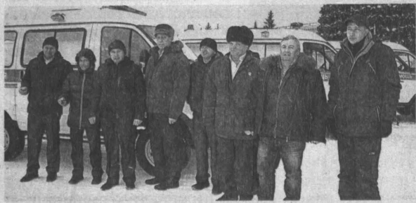
Во время пополнения автопарка автомобилей скорой помощи.