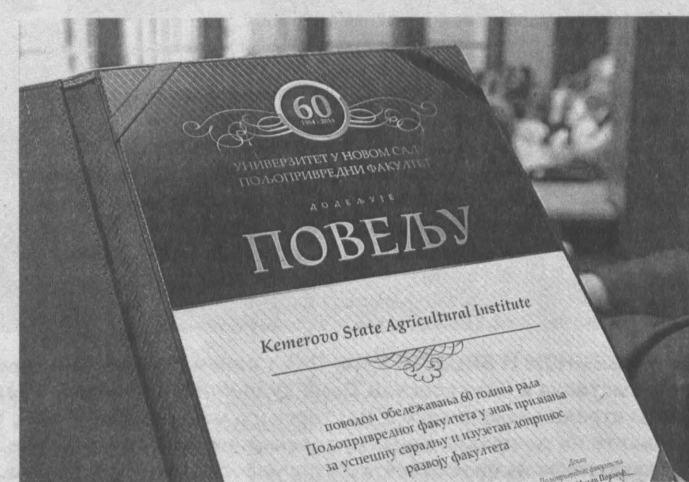
Благодарственное письмо КемГСХИ от сербских коллег за многолетнее взаимодействие.