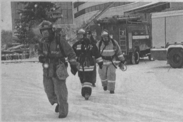
Учения проводились ранним утром, когда в торговом центре еще не было посетителей.