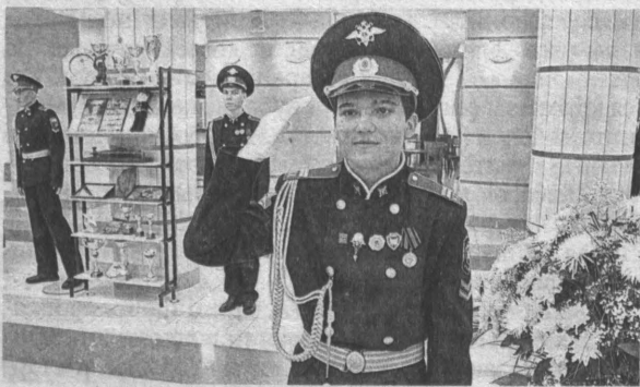
10 лет отмечает губернаторская надетская школа-интернат полиции.