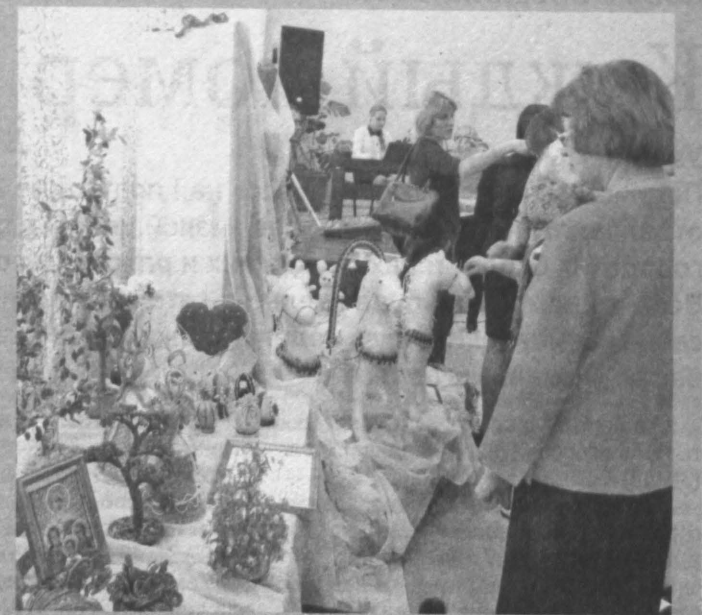
Участники совещания на выставке декоративно-прикладного творчества детей и их родителей в Доме культуры Тяжинского района.

В детдоме «Ласточкин гнездышко» объявили войну социальному сиротству, более 80 % детей оказались здесь при живых родителях. После выяснения всех обстоятельств оказалось, что многие папы и мамы вполне способны воспитывать своих детей. Поэтому в детдоме решили действовать убежде-