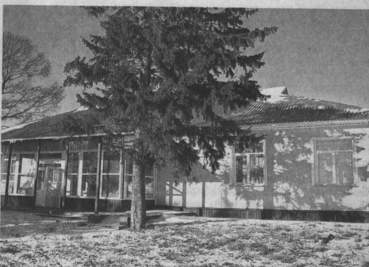
Готовое здание больше года стоит под замком.