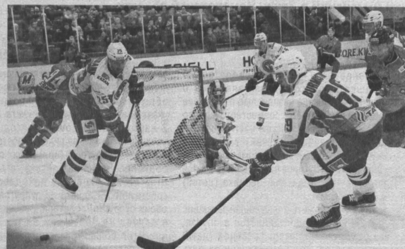
В новокузнецком матче оборона казанцев действовала надежней, и сенсации не произошло.

Сегодня мы сыграли в агрессивный хоккей, иногда накапывали и забирали соперника в его зоне, - с удовлетворением отметил главный тренер «Металлурга» Герман Титов. - Именно такой хоккей я хочу видеть