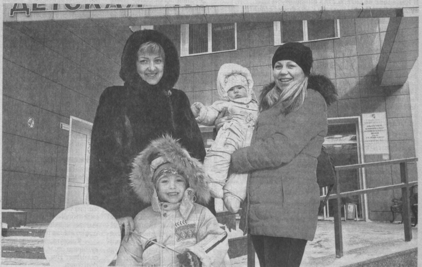
МАЛЕНЬКОЕ ЧУДО. Вчера в Кемеровском областном перинатальном центре им. Л.А. Решетовой отметили Международный день недоношенного ребенка. Здесь собралось несколько десятков семей с детьми, родившимися до срока. Программа мероприятия включала не только вручение подарков, но и консультации педиатра, психолога, инструктора по массажу и обучению плаванию в домашних условиях. В настоящее время в поликлинике центра наблюдаются 860 недоношенных детей в возрасте до трех лет. Из них 335 родились с массой тела до 1,5 кг. А всего с декабря 2010 г. здесь выжили уже более 500 таких младенцев.