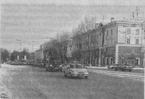
В Кемерове во Всемирный день памяти жертв ДТП прошел ежегодный автопробег.