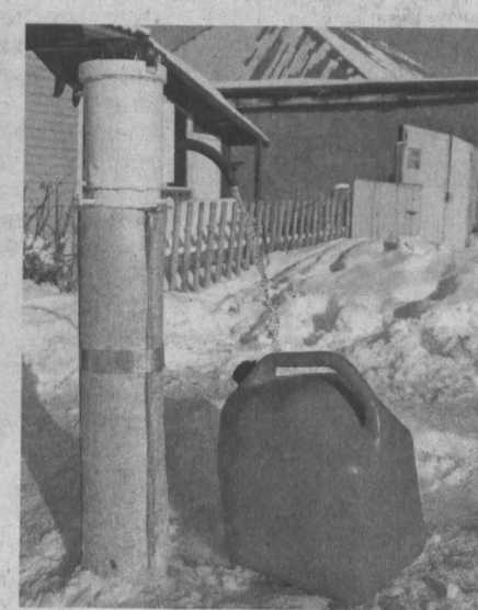
Даже в лютый холод эта колонка в Кемерове не перемерзала, и такое «блага цивилизации», как набор воды, доступно жителям частного сектора.

Обеспеченность горячим водоснабжением в Кузбассе возросла за 2002-2010 гг. на 6,2%. Количество домохозяйств, получающих горячую воду из коммунальной системы, увеличилось на 11,3% (при этом в городской местности - на 9,5%, сельской - в 2 раза). На селе число получающих горячую воду