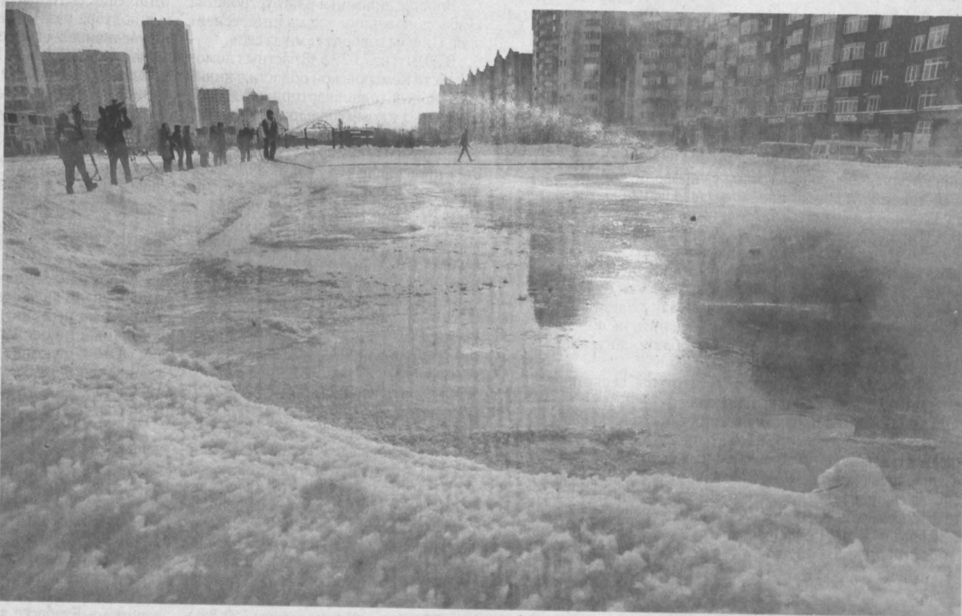
ЛЕДНИКОВЫЙ ПЕРИОД. На этой неделе в Новокузнецке откроется еще один каток, рядом со сквером имени Ермакова. Теплая погода и долгое отсутствие снега не позволяли воплотить замысел раньше. Зато теперь крепчающий мороз быстро схватывает воду, и она превращается в лед буквально на глазах. После открытия здесь организуют пункт проката коньков. Мария ДАРСКАЯ.