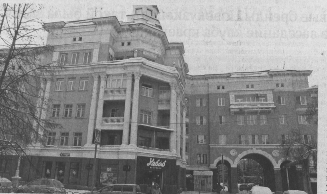
Любопытно, что управляющая компания «РЭУ-9» базируется как раз в этом доме №4. Пора бы уж соседям договориться...