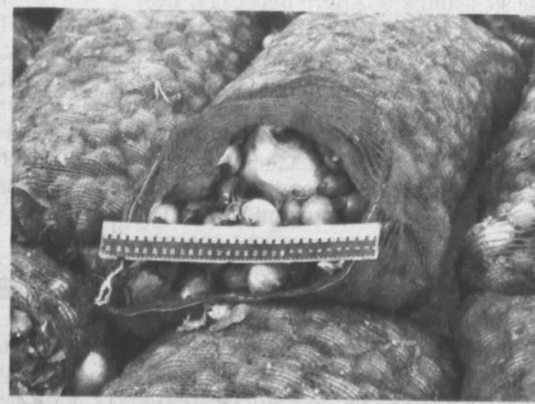
Пакеты с героином, спрятанные в мешках с луком.

По оценкам специалистов, только героина, изъятого за эти несколько декабрьских дней на территории Кузбасса и Казахстана, хватило бы на несколько миллионов (!) условных разовых доз.