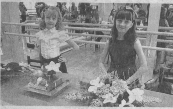
В городе проходит конкурс экологического дизайна для школьников в возрасте от 7 до 18 лет.