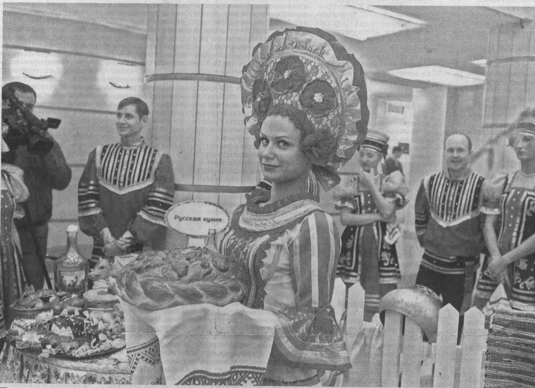
Праздничная частичка кузбасского каравая.

На губернаторском приеме (он состоялся позавчера в честь Дня работников сельского хозяйства и перерабатывающей промышленности) губернатор Аман Тулеев не только отметил достижения кузбасского агропрома, но только назвал имена передовиков отрасли и поздравил сельхозработников, также были озвучены «болевые точки» и поставлены задачи на будущее.