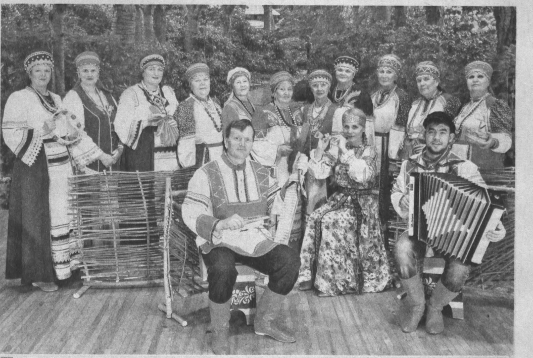
Фольклорный ансамбль «Сударушки».

7.11.1940. Состоялось открытие Дворца культуры Кировского района г. Кемерово