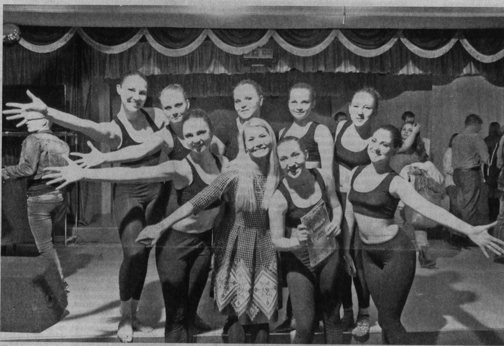
Группа АСТ-141 института хореографии КеМГУКИ с номером «Время» взяла Гран-при на фестивале первокурсников «Прорыв-2014».

Завершается Год культуры, и главный культурный вуз Кузбасса отмечает сегодня сразу два юбилея: 45 лет со дня основания и десять – в статусе университета