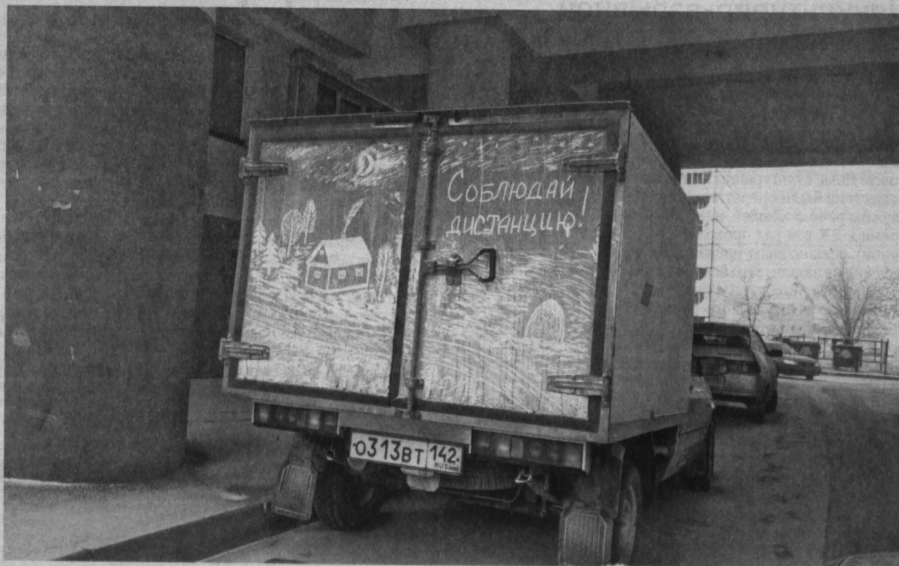
ГРЯЗНОЕ ИСКУССТВО. В мире автомобилистов родилась новая «фишка». На грязных машинах стали появляться всевозможные рисунки. Одним из первых свой грязный автомобиль в настоящий арт-объект превратил американский художник Скотт Уэйд. Он использует окна как полотно для создания удивительных, но, к сожалению, недолговечных шедевров. На одну такую картину он тратит не меньше четырех часов. Вот и в Кемерове нашлись последователи Уэйда, так называемые художники грязных автомобилей. Хотя их работы пока далеки от совершенства, но всё равно вызывают живой интерес у горожан.