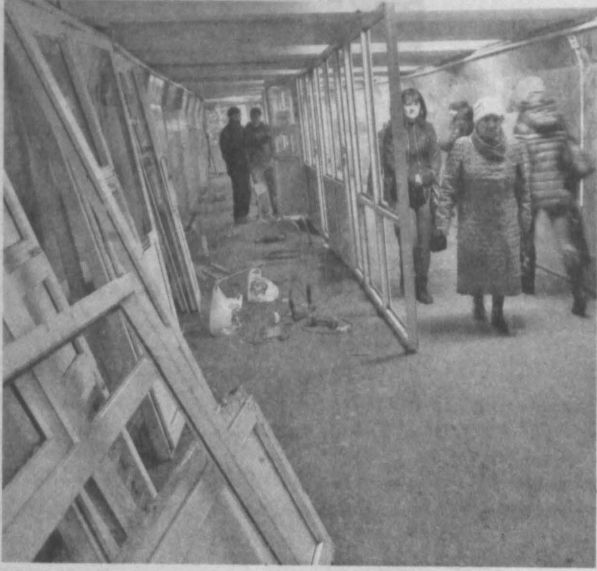
Ремонт подземки будет произведен, но позже. Конкретные сроки не называются.