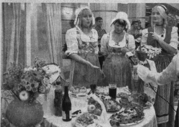
Перед губернаторским приемом приглашенные могли познакомиться с продукцией местных сельхозпроизводителей.