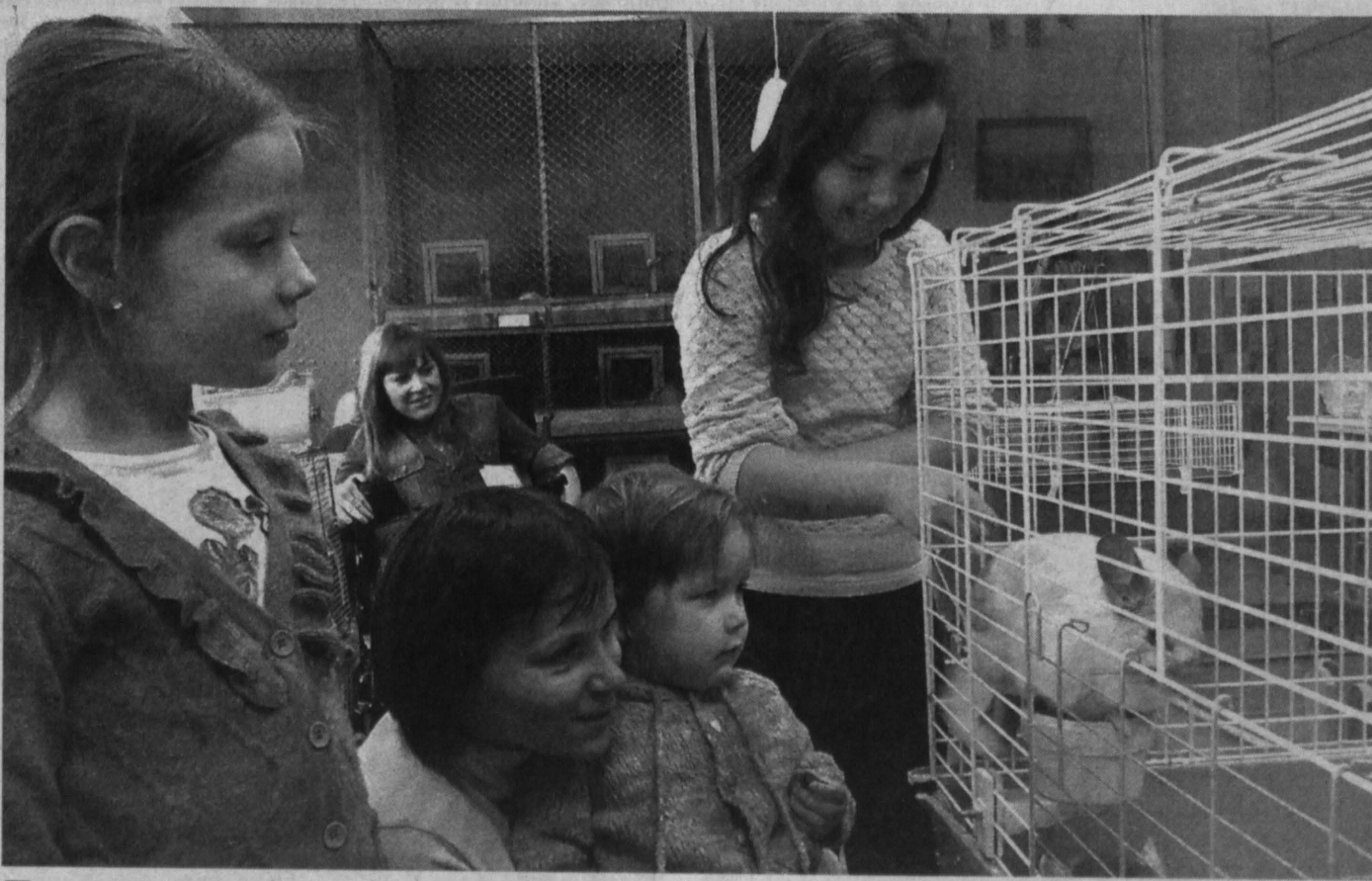
ПОДАРИЛИ ПРАЗДНИК. В рамках благотворительной программы «Добрые традиции» в Новокузнецке состоялась мероприятие «Найди себя». Ребят из опекаемых и многодетных семей ждала интересная экскурсия по Дворцу творчества им. Н.К. Крупской. Каждый любознательный заглянул в зооцентр «Планета». Здесь в условиях неволи содержится уникальные животные и птицы. Также ребята посетили лабораторию транспортного моделизма, а в заключение праздника педагоги провели мастер-классы по различным техникам прикладного искусства.