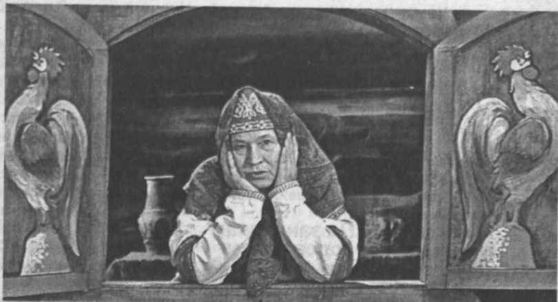
Бабушку из окошка в исполнении актрисы Анастасии Зуевой в советских киносказках любили в стране все.

от приемной мамы, но не от вымышленной городской, а от... крестьянки Марфы Волнушкиной!