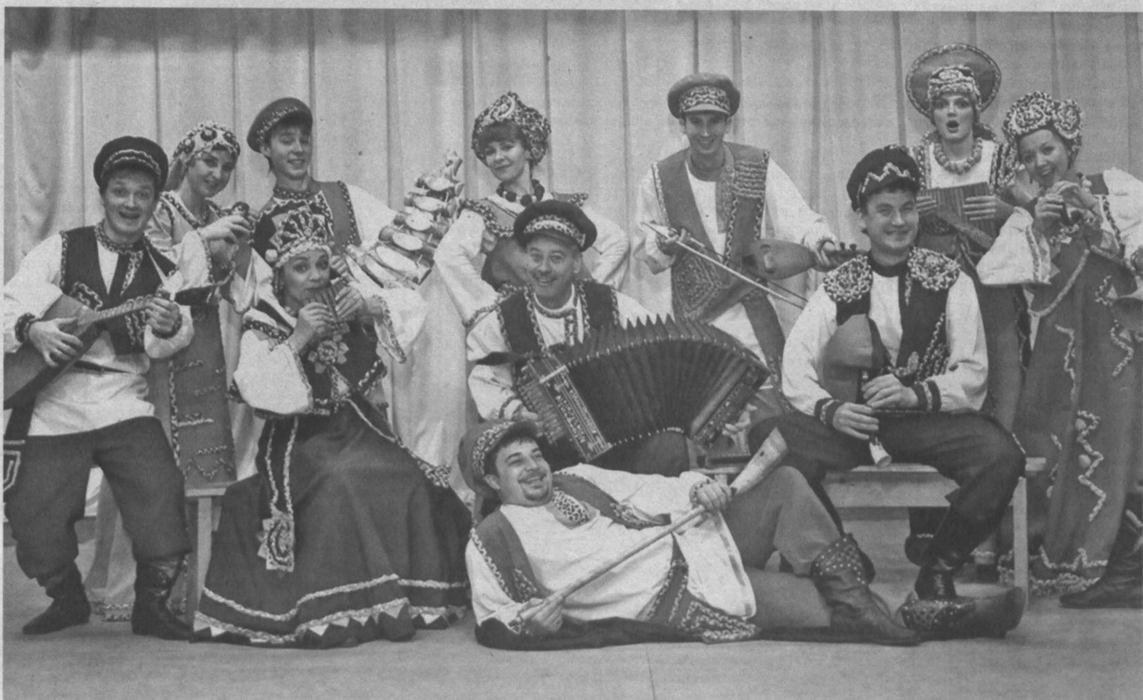
Ансамбль народной музыки «Скоморохи».

Кульминацией праздника в Сочи станет большой гала-концерт 4 ноября — День народного единства. Юлия СЕРГЕЕВА.