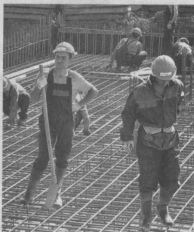
■ Купи медицинский полис и работай спокойно.