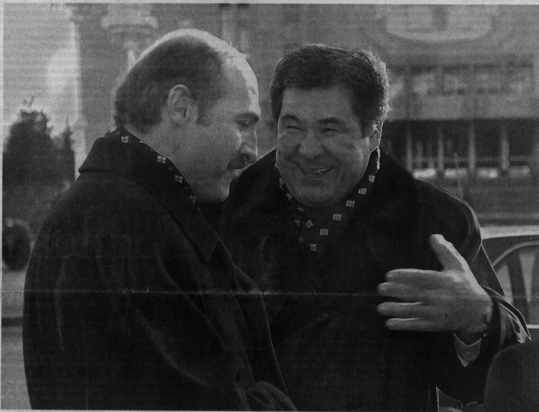
Амана Тулеева и Александра Лукашенко связывает многолетняя дружба.

На недавнем заседании совета при полпреде президента РФ в СФО и совета межрегиональной ассоциации «Сибирское соглашение» (МАСС), которое проходило в Новосибирске в рамках Дней Беларуси в Сибири, губернатор Кузбасса Аман Тулеев похвалил белорусские продукты, пожурил конструкторов самосвалов, рассказал о совместных кузбасско-белорусских планах, купил новую технику и предложил использовать белорусский опыт поддержки бизнеса.