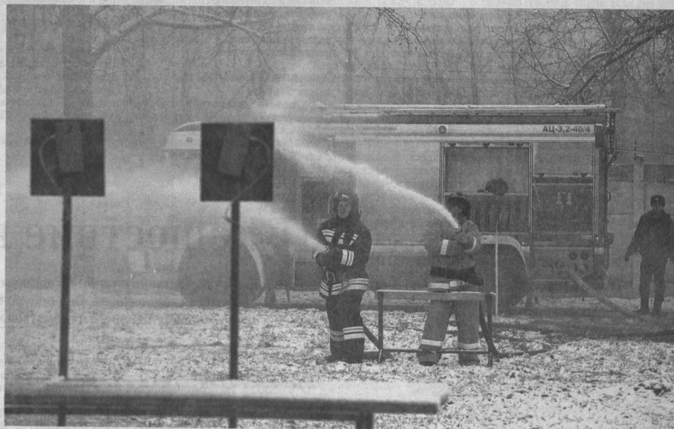
ПОЖАРНЫЙ БИАТЛОН. В Новокузнецке впервые прошли областные соревнования по пожарному биатлону. Правила в нем почти такие же, как и в обычном биатлоне, только вместо лыж - пожарные машины, а вместо винтовок - пожарные стволы. Конкурс состоял из трех этапов, на каждом из которых участники демонстрировали профессиональные навыки при тушении пожара, наличие необходимых для огнеборцев морально-волевых качеств. Победу одержала команда 11-го отряда Федеральной противопожарной службы по Кемеровской области, город Новокузнецк.