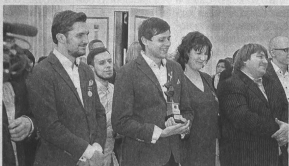
Уже третий год подряд «КемБридж» играет в Высшей лиге КВН, при этом второй сезон выходит в полуфинал.