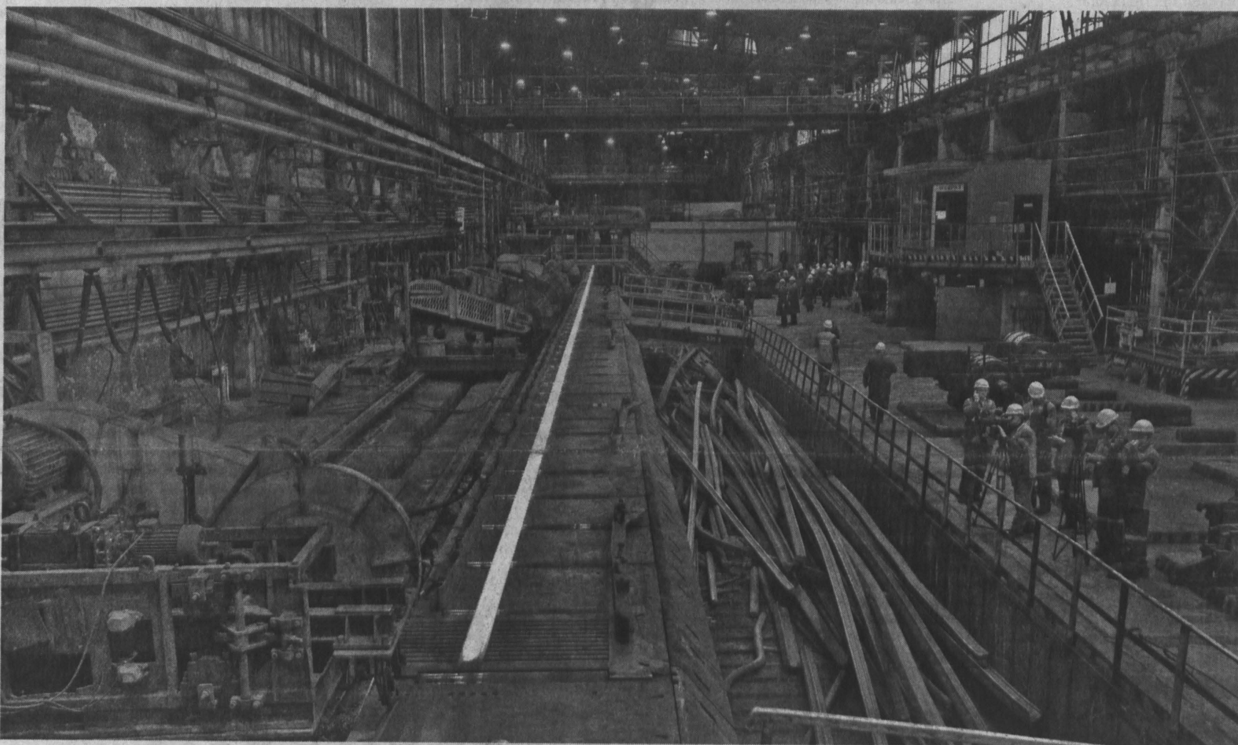
Металлурги Новокузнецка сегодня готовы выпускать все виды рельсов.

На заседании Рельсовой комиссии металлурги и железнодорожники обсуждали вопросы улучшения качества рельсов. Для Кузбасса это знаковое событие, ведь основным их поставщиком в России является новокузнецкий Евраз ЗСМК