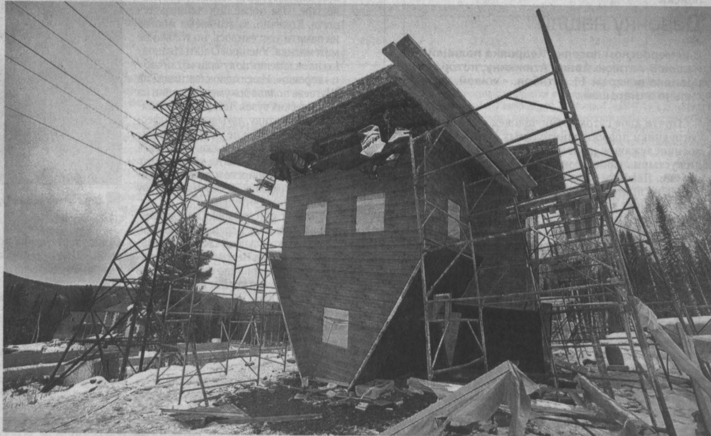
ПЕРЕВЕРНУТЫЙ ДОМ. Так называется единственный в Кузбассе аттракцион, который уже в конце месяца будет готов принять первых гостей горнолыжного курорта в Шерегеше. В нем все будет вверх ногами — настоящая мягкая мебель, столы, стулья. Кстати, на входе к «полу», он же потолок, уже прикреплен снегоход и снегоуборочная машина. Проект реализуют предприниматели из Барнаула. По их словам, они надеются, что аттракцион будет пользоваться спросом, поскольку эффект от перевернутого пространства привносится к тому, какой получают на американских горках. Кстати, аналогичный проект они уже успешно реализовали в Республике Алтай.